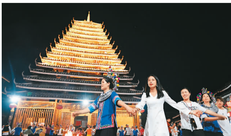
▲ 村民带领游客在鼓楼前跳起欢快的多耶舞。