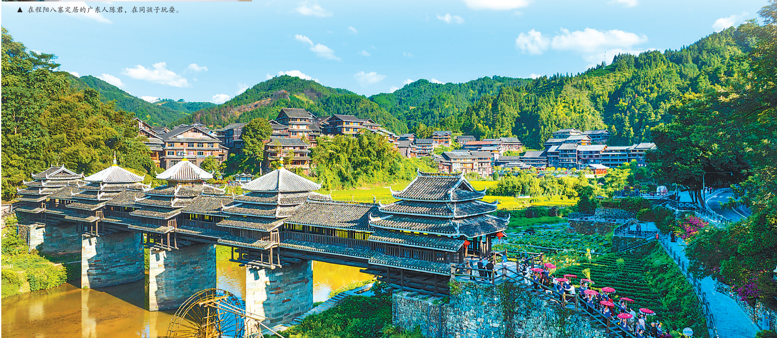
▼ 俯瞰程阳八寨。