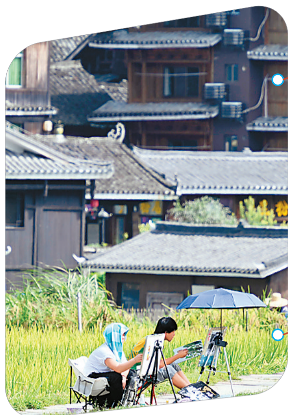
▲ 画家在程阳八寨写生。