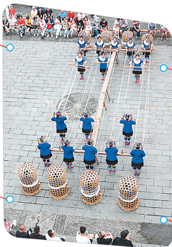
▲ “百家宴”开始前的演出。