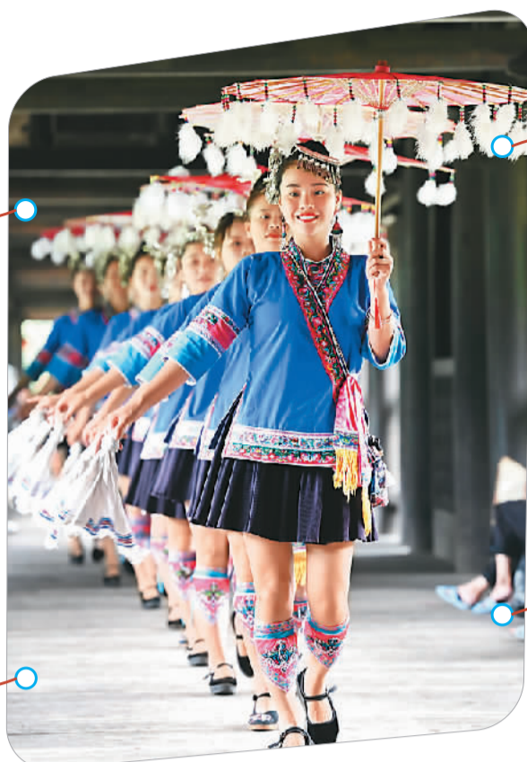
▲ 村民身穿侗族服装从风雨桥上经过。