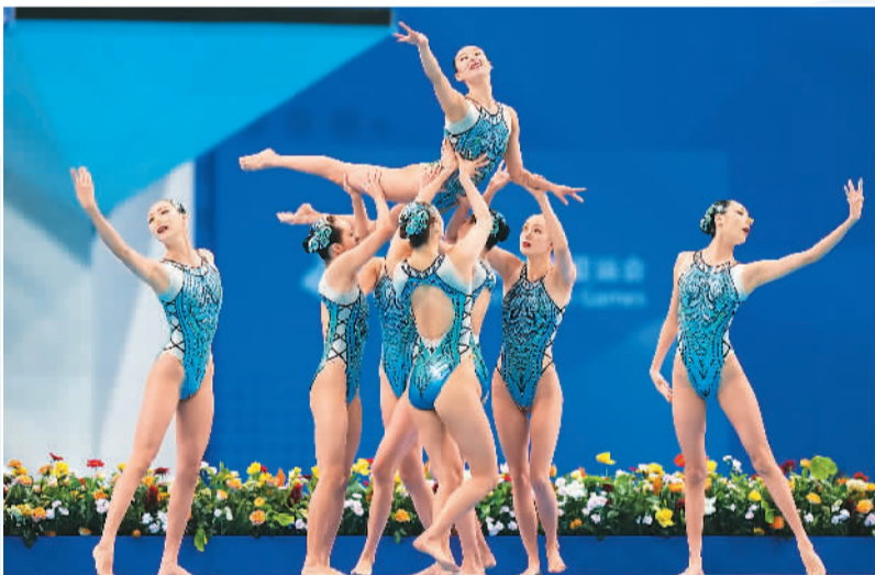
10月8日，中国队在亚运会花样游泳项目集体自由自选比赛中。