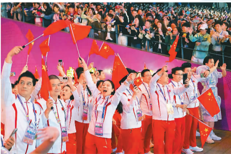
10月8日，中国体育代表团在闭幕式上入场。