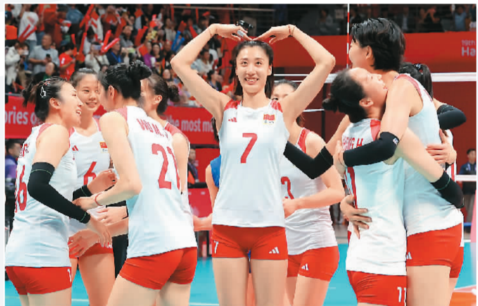
10月7日，中国队球员在亚运会女排决赛夺冠后向观众致意。