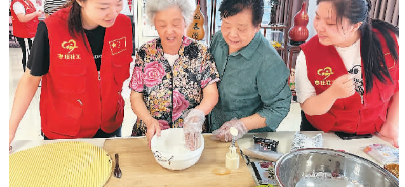
山东省枣庄市市中区深入实施养老服务集成化改革，构建全域化养老服务体系，为老年人提供更加优质的服务。截至目前，该区建成镇（街）综合养老服务中心11处、社区养老服务站（日间照料中心）80处。图为近日该区社工在龙凤社区开展手工制作月饼活动。

中国华电有关负责人表示，10年来，中国华电积极参与共建“一带一路”，电力项目走进印尼、柬埔寨、孟加拉国等20多个国家，公司境外在运装机容量超350万千瓦。中国华电还将继续努力在水电、风电、光伏等清洁能源领域优质打造更多标志性工程。