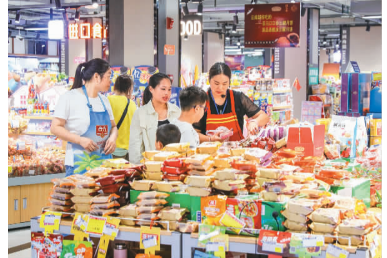
为迎接中秋国庆长假，全国各地积极组织商品投放，农贸市场和商超货源充足，保障市民消费需求。图为9月29日，市民在四川省泸州市合江县荔家超市选购琳琅满目的中秋月饼。

持更多大湾区居民参与试点。二是扩大参与机构范围，新增符合要求的证券公司作为参与主体，为“南向通”“北向通”个人客户提供投资产品及相关服务。三是扩大“南向通”“北向通”合格投资产品范围，更好满足大湾区居民多样化投资需求。四是适当提高个人投资者额度。五是进一步优化宣传销售安排，引导金融机构为大湾区居民提供优质金融服务。