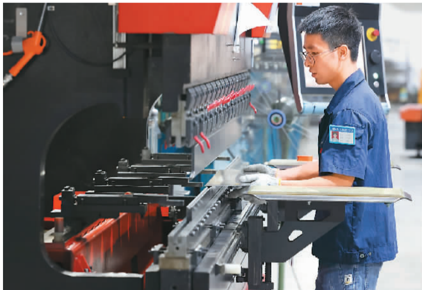
福建省福州市高新技术产业开发区落实支持企业科研成果转化落地、技改扩能、税费优惠等扶持政策，推动制造业高质量发展。图为开发区一家机械设备制造企业内，工人在生产线上赶制订单产品。