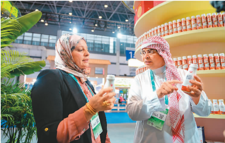
▲两位外国嘉宾在展会上品尝椰子饮品。

在巨大的市场需求和利好政策引导下，海南省深耕椰树种植、椰产品加工、椰文化旅游，“产椰链”各方都积极行动起来。