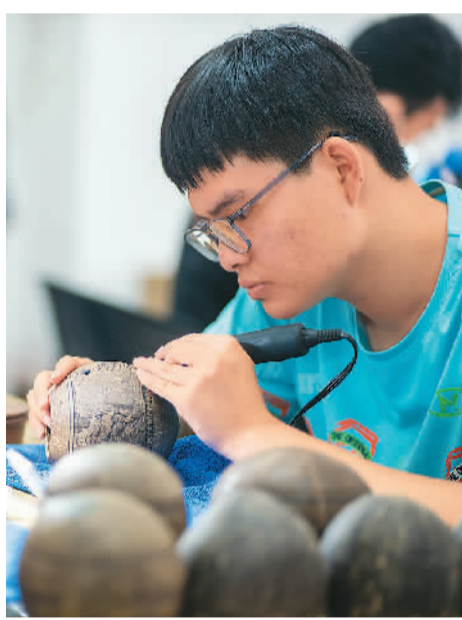
▲在海南爱心椰文化产业有限公司椰文化研发基地，工作人员在制作椰雕。