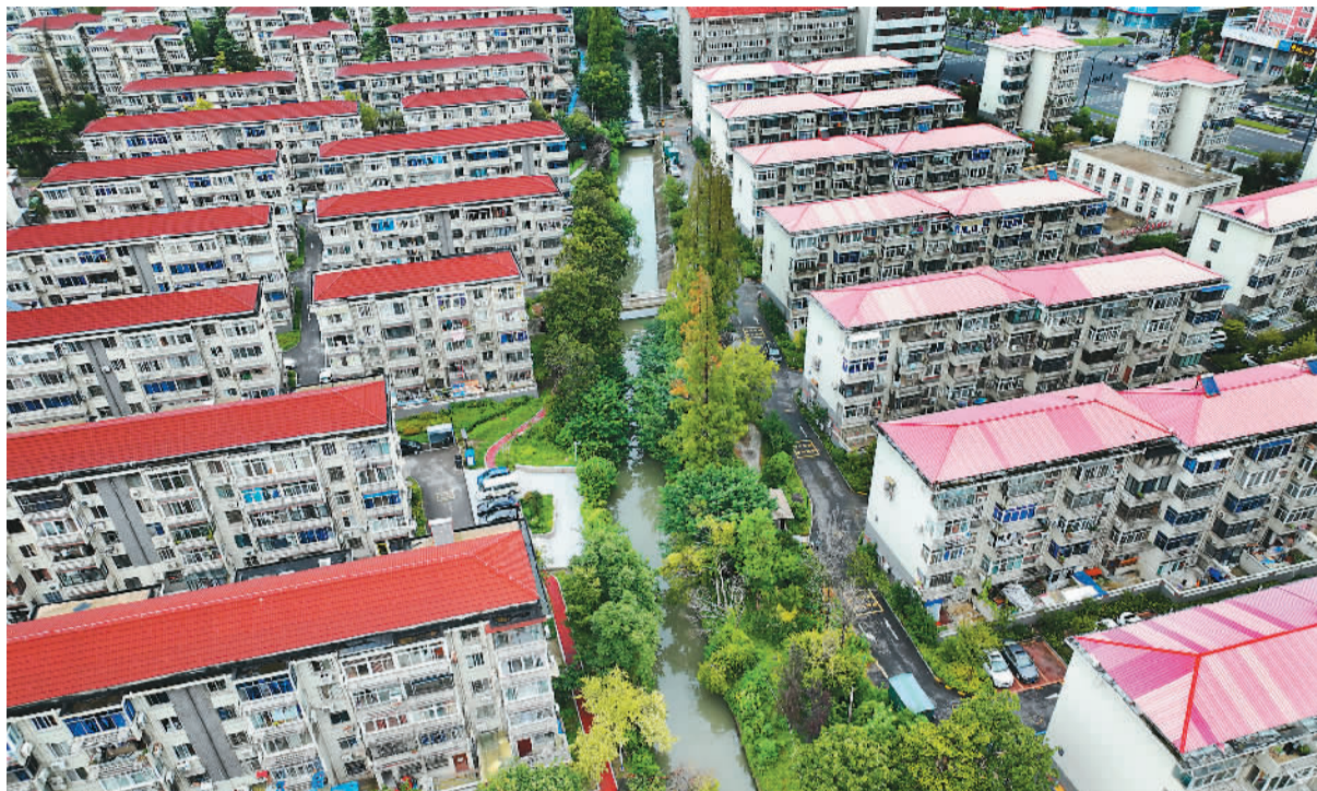
江苏省南通市崇川区辖区内2000年前建成并交付使用的老旧小区共有251个。从2020年起，崇川区积极推进老旧小区改造，3年累计完成了112个老旧小区改造，老百姓居住环境有了显著改善。图为崇川区新城桥街道改造后的老旧小区新貌。

宁、库车机场为基地，进行疆内“环飞”和南北疆“串飞”，以支一支航线为主，共执飞184条航段，涵盖疆内东西最长航线哈密—喀什、疆内南北最长航线于田—喀纳斯，以及疆内最短航线伊宁—昭苏。飞机平均日利用率9.2小时，最高日利用率13.5小时，总飞行时间276小时。