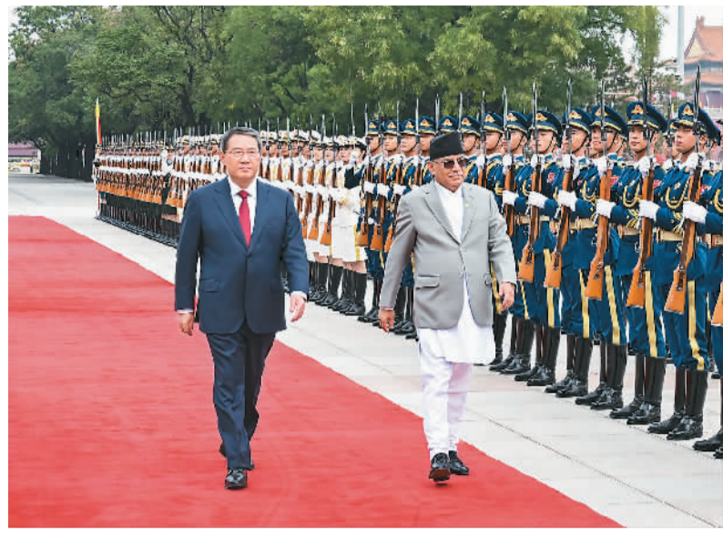
9月25日上午，国务院总理李强在北京人民大会堂同来华进行正式访问的尼泊尔总理普拉昌达举行会谈。这是会谈前，李强在人民大会堂东门外广场为普拉昌达举行欢迎仪式。

涉及彼此核心利益和重大关切问题上相互支持。赵乐际介绍了中国全过程人民民主的理念和实践，表示中国全国人大愿同尼泊尔议会一道，以落实两国领导人重要共识为主线，加强立法机构交流合作，助力各自国家民主政治发展，为两国各领域务实合作提供法律保障。 普拉昌达表示，尼中友好源远流长，尼坚定奉行一个中国原则，愿深化双边各领域务实合作，推动两国面向发展与繁荣的世代友好的战略合作伙伴关系取得丰硕成果。 洛桑江村参加会见。