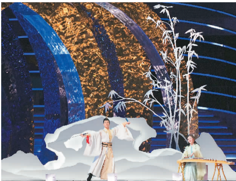
▲ 演员在开幕式上表演。