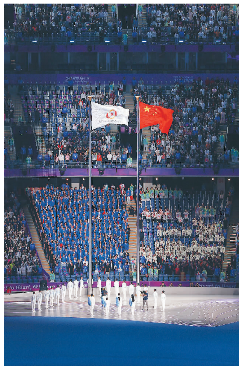
▲ 中华人民共和国国旗和亚奥理事会会旗在开幕式上升起。