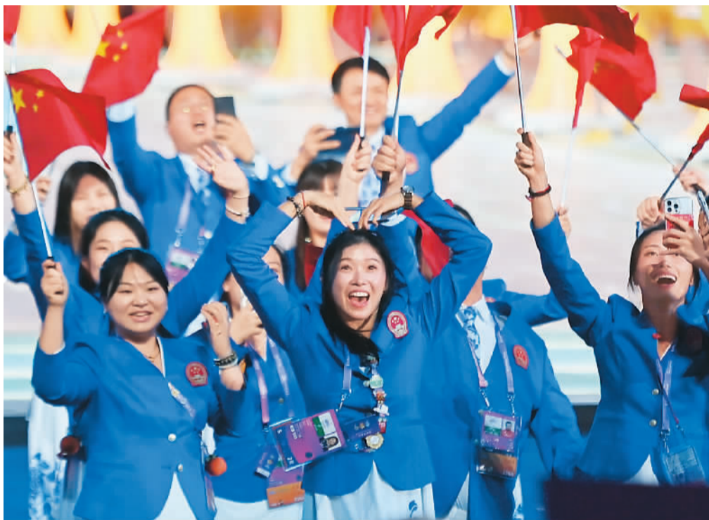
特刊统筹:李 舫 田晓明 特刊责编:熊 建 石 畅 周妹芸