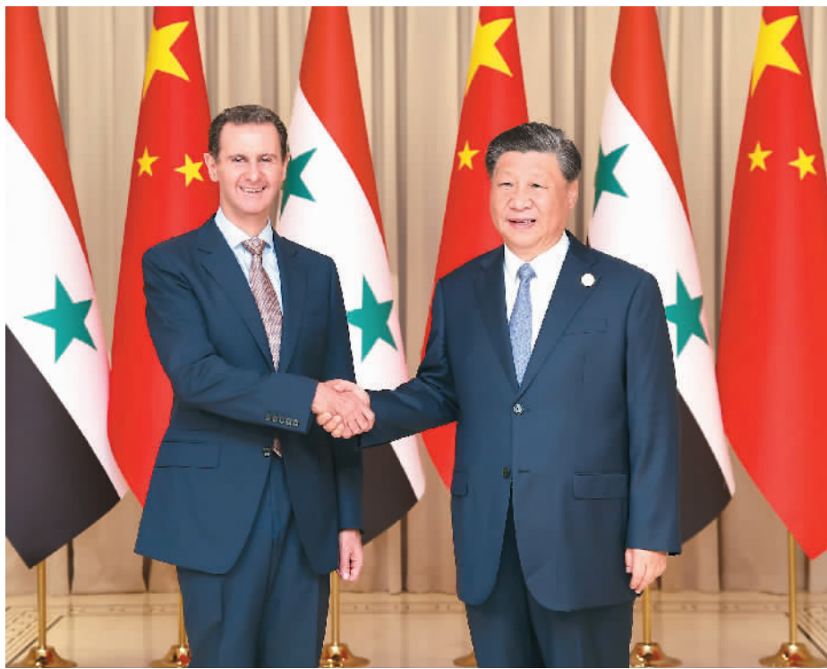
9月22日下午,国家主席习近平在杭州西湖国宾馆会见来华出席第19届亚洲运动会开幕式的叙利亚总统巴沙尔。

本报杭州9月22日电 (记者李中文、王海林) 9月22日下午,国家主席习近平在杭州西湖国宾馆会见来华出席第19届亚洲运动会开幕式的叙利亚总统巴沙尔。两