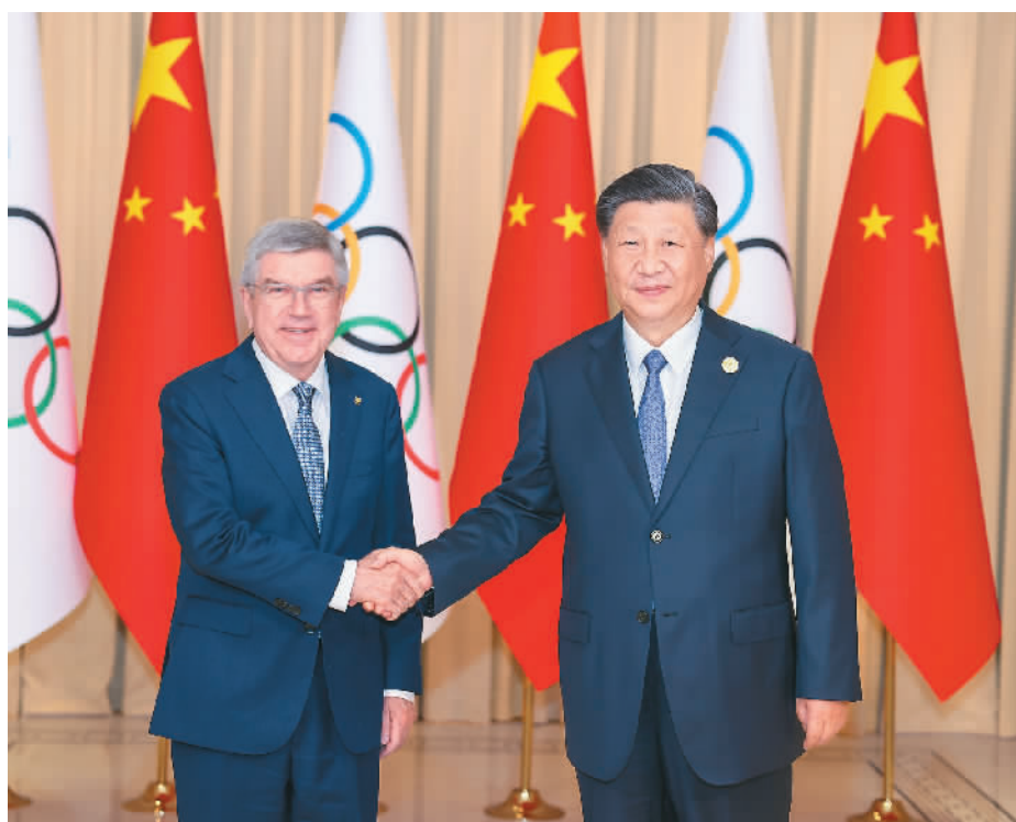
9月22日下午,国家主席习近平在杭州西湖国宾馆会见来华出席第19届亚洲运动会开幕式的国际奥林匹克委员会主席巴赫。

本报杭州9月22日电 (记者王海林、顾春) 9月22日下午,国家主席习近平在杭州西湖国宾馆会见来华出席第19届亚洲运动会开幕式的国际奥林匹克委员会主席巴赫。