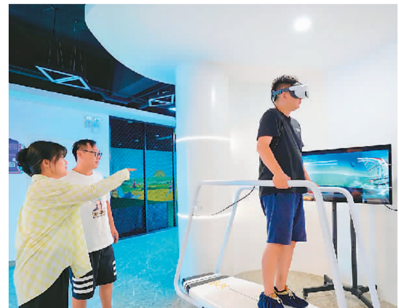
浙江省杭州市余杭区积极推进乡村数字化人才队伍建设，通过打造乡村旅游科技创新应用新场景，促进科技与文旅相融合，提升乡村品质。图为近日该区良渚街道元宇宙体验馆内，游客在工作人员指导下体验极速滑雪项目。

据介绍，上海将根据重点行业领域发展和专业人才需求实际，动态调整证书目录，加快建设高水平人才高地。