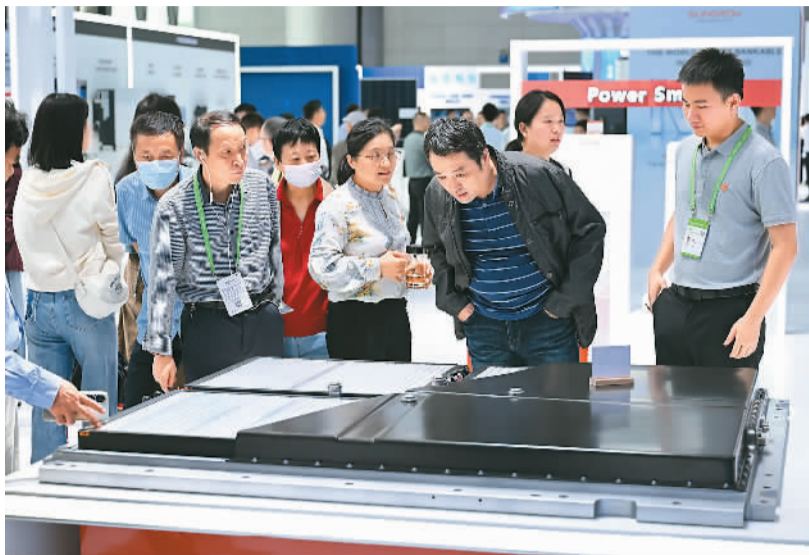
9月20日，以“智造世界·创造美好”为主题的2023世界制造业大会在安徽省合肥市举行，大会集中展示制造业新模式、新业态、新技术、新产品，吸引大量市民参观体验。图为人们在大会现场观看一款新能源汽车电池包。