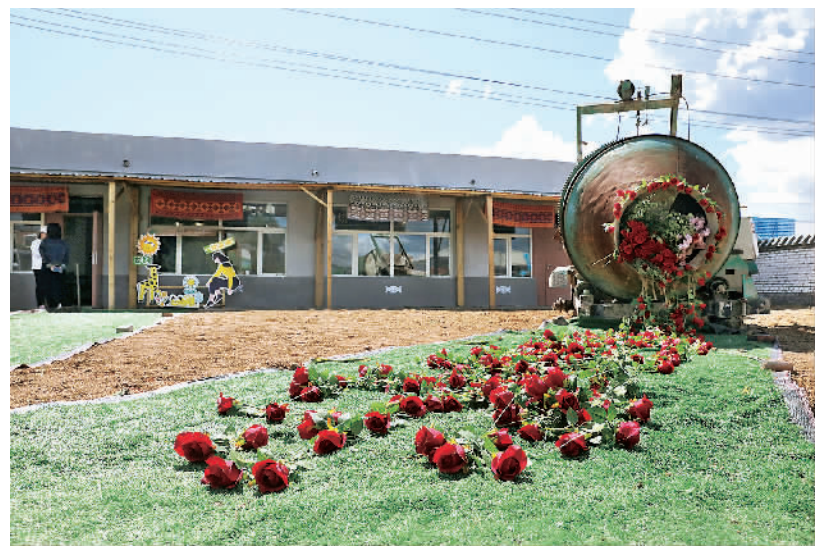
西口村“乡村艺术沙龙在我家”中央美术学院作品体验展外景。