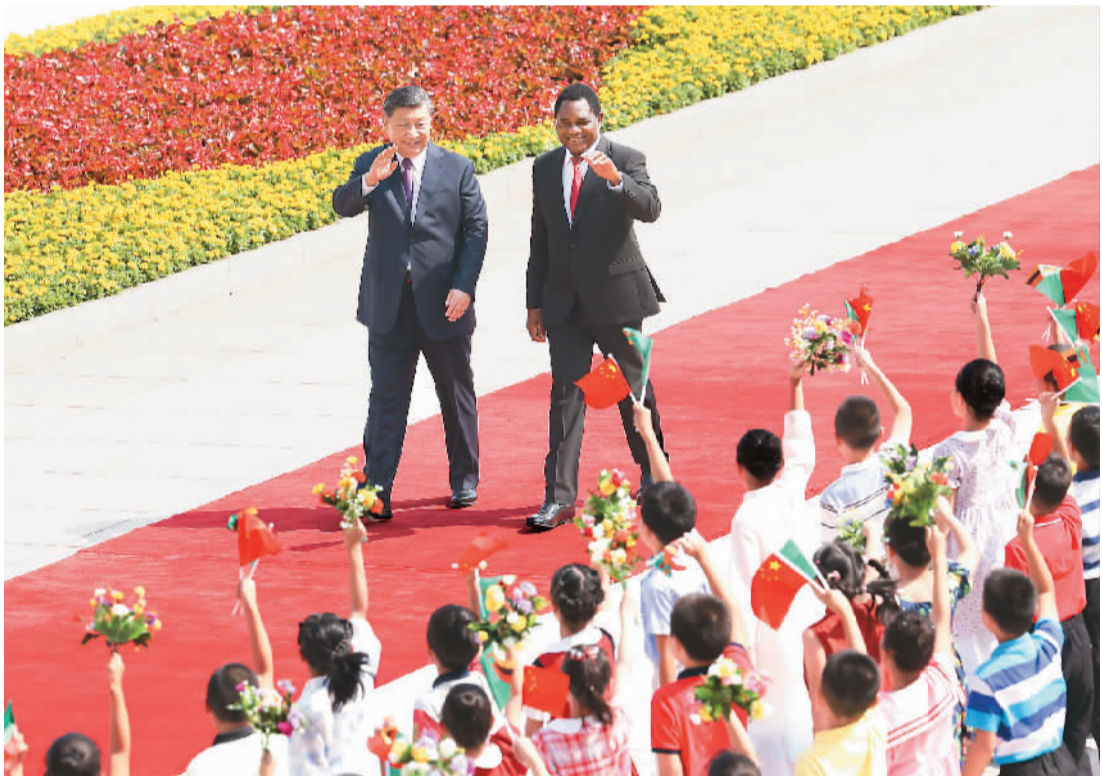
九月十五日上午,国家主席习近平在北京人民大会堂同来华进行国事访问的赞比亚总统希奇莱马举行会谈。这是会谈前,习近平在人民大会堂东门外广场为希奇莱马举行欢迎仪式。

新华社北京9月15日电 (记者郑明达) 9月15日上午,国家主席习近平在人民大会堂同来华进行国事访问的赞比亚总统希奇莱马举行会谈。两国元首宣布,将中赞关系提升为全面战略合作伙伴关系。 习近平指出,中赞传统友谊由两国老一辈领导人亲手缔造,历经国际风云变幻的考验。坦赞铁路是中非友好的象征,两国人民彼此怀有特殊友好情谊。中方始终从战略高度和长远角度看待和发展中赞关系,愿同赞方一道努力,将两国深厚的传统友谊转化为新时代合作共赢的不竭动力,推动中赞关系行稳致远,不断迈上新台阶。 习近平强调,中国支持赞比亚维护国家主权、安全、发展利益,探索符合本国实际的发展道路,愿同赞方加强国际交往和治国理政经验交流,在涉及彼此核心利益和重大关切问题上坚定相互支持。中国高质量发展的成功展现了世界现代化模式的多样性,中国高质量发展和现代化进程将继续为包括赞比亚在内的世界各国带来新机遇。中方愿同赞方一道,以共建“一带一路”为引领,拓展基础设施建设、农业、矿业、清洁能源等领域合作,共同实现发展振兴。中方鼓励更多赞比亚优质产品进入中国市场,支持更多中资企业赴赞比亚投资兴业。双方要办好明年两国建交60周年庆祝活动,加强教育培训、卫生医疗、文化旅游等领域交流合作,进一步密切人员往来,增进两国人民相知相亲。 习近平指出,当前,发展中国家群体性崛起,国际影响力不断增强,已经成为不可逆转的时代潮流。我们要加强团结协作,践行真正的多边主义,坚定维护国际公平正义,努力提升发展中国家话语权,维护两国和广大发展中国家共同利益。中非合作已经成为南南合作和国际对非合作的引领者。真诚平等、互利共赢、捍卫正义、开放包容这些中非友好的主线和底色从未改变。中国坚定支持非洲国家走独立自主的发展道路,坚定支持非洲国家成为世界政治、经济、文明发展的重要一极。中方愿同包括赞比亚在内的非洲国家一道,落实好“支持非洲工业化倡议”等中非