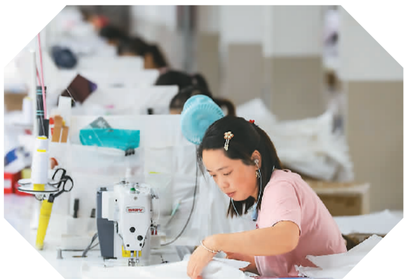
9月11日，在江苏省淮安市一家民营企业，工人正在加工羽绒寝具。

自主创新的重要性愈发凸显，民营企业不约而同持续加码研发投入。过去的一年里，民营企业500强聚焦新技术、新业态、新模式，持续加大研发投入力度，提高科研成果转化率，加快数字化转型、绿色低碳发展、品牌