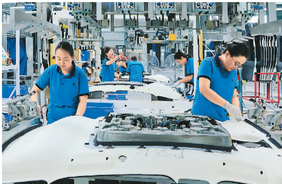
8月18日，在河南省开封市尉氏县先进制造业开发区工业园，一家汽车配件生产企业的工人在生产线上忙碌。

培育步伐，努力提升发展质量和水平。民营企业500强中，研发人员占员工总数超过3%的企业有326家，超过10%的企业有175家。研发经费投入强度超过3%的企业有86家，超过10%的企业有8家。