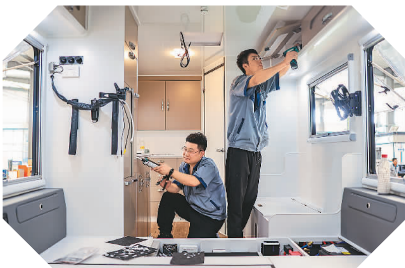
8月24日，山东省荣成市一家房车制造企业的工人在安装房车组件。