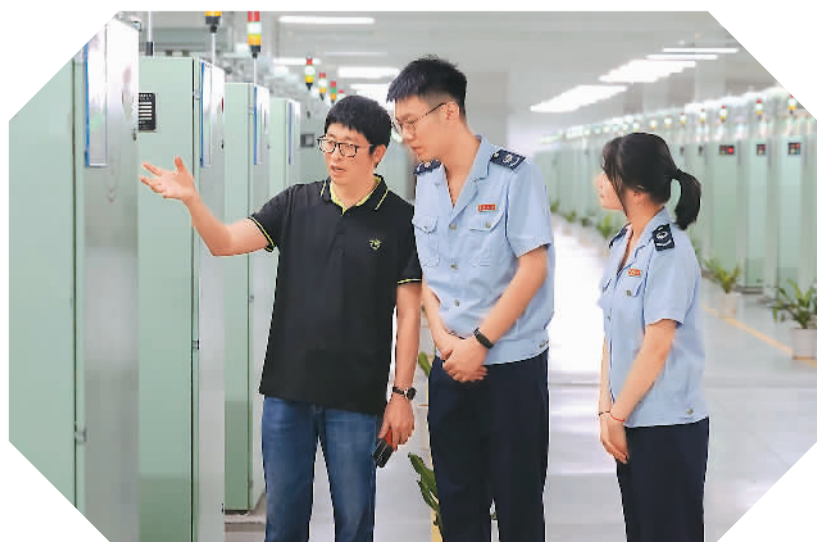
8月17日，福建省福州市长乐区税务部门工作人员，在当地一家智能制造企业了解生产情况，讲解税收优惠政策。