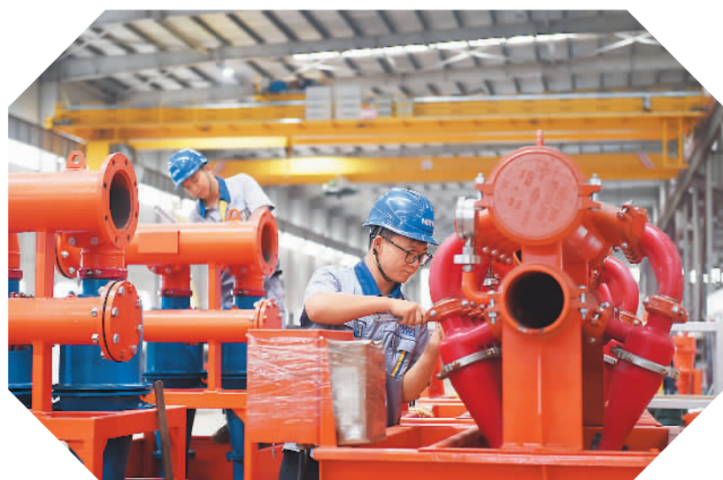
8月27日，河北省邢台市一家“小巨人”企业的工人在组装钻井泥浆环保处理装置。

民营经济的未来发展前景光明。《中共中央国务院关于促进民营经济发展壮大的意见》今年7月发布以来，各地区积极贯彻落实，推动民营经济稳定恢复、回升向好。