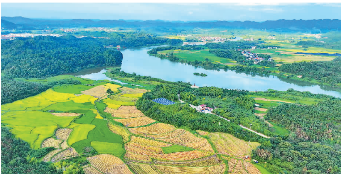
江西省抚州市宜黄县积极探索建立“以河养河”长效管护新机制,通过保障水安全、防治水污染、治理水环境、修复水生态和挖掘水文化,实现河湖生态价值转换,打造“生态安澜、环境优美、人水和谐”的“幸福河湖”乡村。 图为宜黄县桃渡镇文坪村秋景。

“十四五”以来,中国新型融合基础设施建设取得积极进展,北斗、5G等信息基础设施深化应用,出行服务品质持续提升,数字赋能行业监管成效逐步显现。交通运输部规划研究院信息所副所长陈琨介绍,目前中国高等级航道电子航道图覆盖率超过70%,已建和在建自动化集装箱码头超过20个,已安装使用北斗终端的道路运输车辆客运车辆超1000万辆,重点领域北斗系统应用率超过95%。