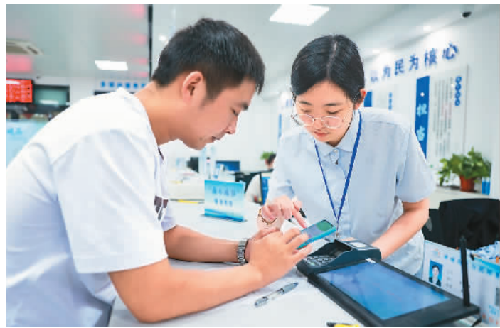
近日，在江苏省靖江市靖城街道为民服务中心，工作人员协助市民缴纳灵活就业养老保险。

随着经济社会的发展，社会保险经办出现了一些新情况、新问题，比如证明材料偏多、转移接续不畅、经办时限不明确、基金跑冒滴漏等，需