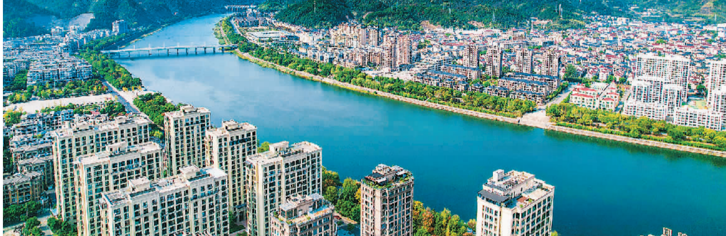
浙江省桐庐县分水镇风光。