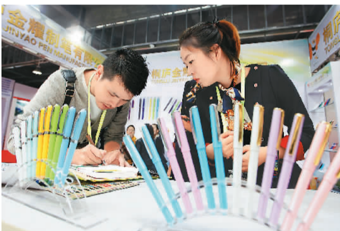
在分水镇举办的中国笔业博览会上的一家制笔企业展台。