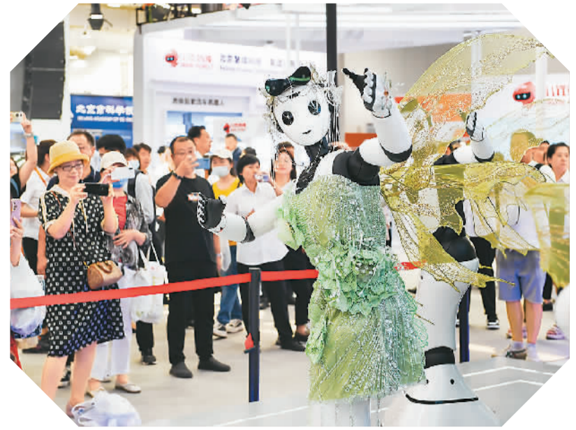
9月5日，在服贸会首钢园区的电信、计算机和信息服务专题展内，参观者观看人形智能服务机器人演示。