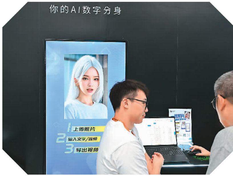
9月5日，在服贸会首钢园区，参观者了解AI“数字人”形象产品。