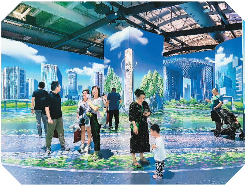
9月5日，在服贸会首钢园区电信、计算机和信息服务专题展区元宇宙馆，观众体验虚拟城市场景。