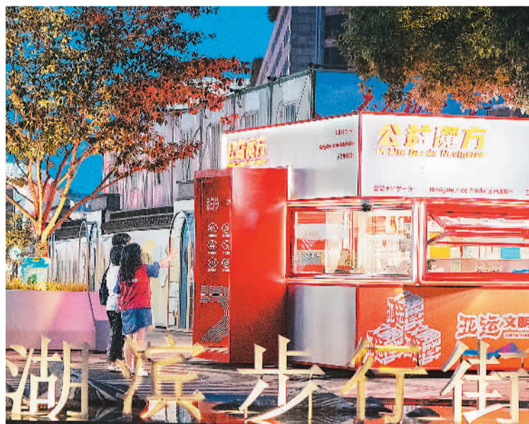
近年来，浙江省杭州市上城区湖滨商圈建设“15分钟服务圈”，为市民和游客服务。图为驻点志愿者正在为游客提供信息咨询、应急救援等一站式服务。

据悉，为拉动旅游服务贸易提升、促进旅游消费增长，本届服贸会还设置了以“引领文旅消费，共享美好生活”为主题的旅游展，通过“文旅新生活”“演艺新空间”“传统新时尚”“区域新合作”四个主题单元，重点展示京津冀旅游资源，现场提供多门类、高品质的旅游产品，打造互动式、沉浸式演艺空间。