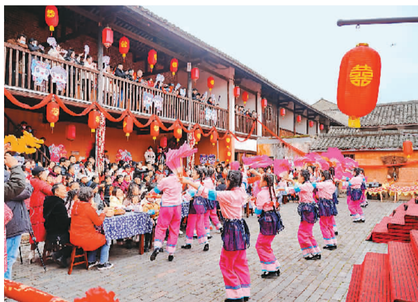
龙南市关西镇新围村的客家围屋里，村民们观看文化惠民大舞台赣南采茶戏展演。 朱海鹏摄（人民视觉）

据了解，龙南市文旅部门以实用为导向，以利用促保护，引导各乡镇因地制宜、因陋制宜打造业态，突出自身特色，塑造旅游品牌，走差异化发展之路。目前，龙南市已打造了桂园里休闲民宿集聚区、双子围宿集、九连山镇碧玉休闲度假区等民宿集聚区，发展了70多家乡村民宿，预计到年底，龙南市将有休闲民宿集聚区11个，客房数1000多间。