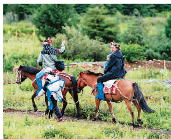
丽江市玉龙纳西族自治县玉湖村近年来开发生态马场、民族文化传承研学基地等旅游项目，图为游客在玉湖村体验骑马。

据介绍，“你好！中国”2023黄河主题旅游海外推广季专场活动在海外推出黄河文化旅游带精品线路多语言版、“发现中国黄河之美”——黄河主题视频全球展映、“看九曲黄河听华夏故事”主题展、“遇见黄河”文化旅游资源展播、“天下黄河”慢直播等共计约940个数字产品。目前，该活动已成功在巴西圣保罗、美国洛杉矶、韩国首尔举办3场推介会，将推动沿黄省份入境游发展，加深国际旅游合作和民间交往。