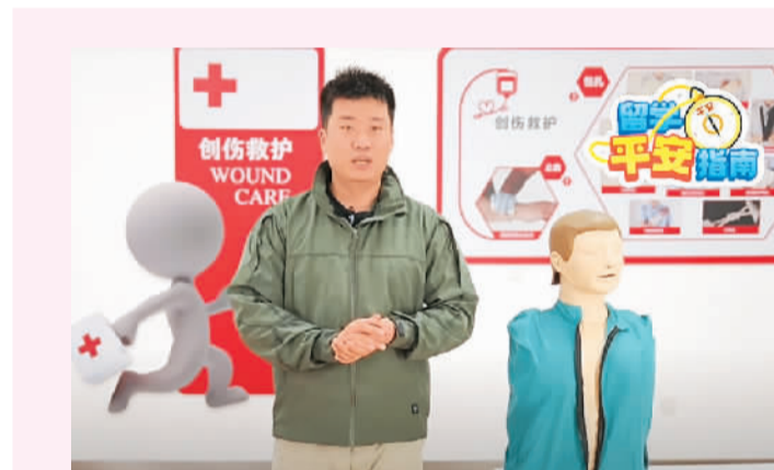
正在讲解安全求生技巧。资料图片