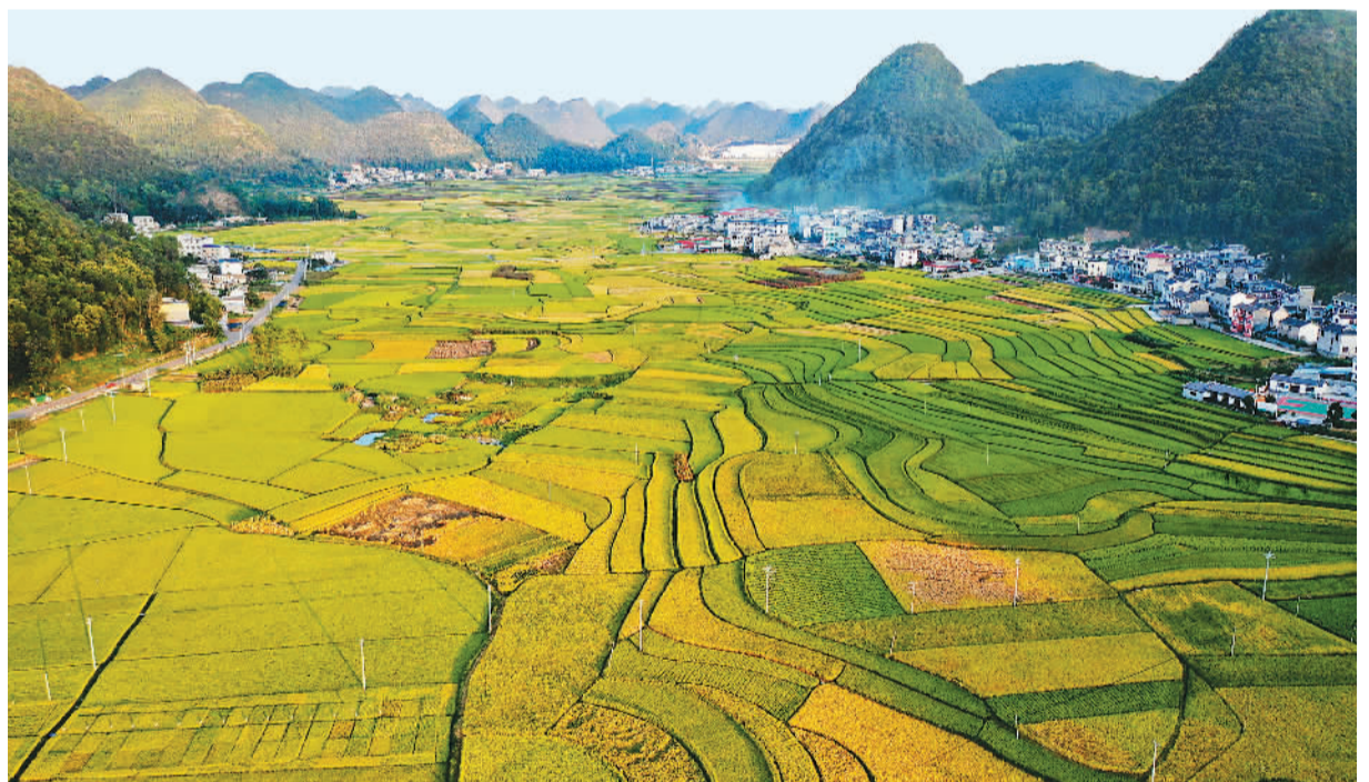
近日，贵州省黔东南苗族侗族自治州安龙县招提街道海庄村田野稻谷陆续成熟，在阳光照耀下，金黄的稻谷与道路、村庄、连绵起伏的青山相互映衬，勾勒出一幅色彩斑斓的丰收图景。

本届敦煌文博会由中央宣传部指导，甘肃省人民政府、文化和旅游部、国家广播电视总局、中国贸促会共同主办，以“沟通世界：文化交流与文明互鉴”为主题。50多个国家、地区和国际组织的1200多名嘉宾参会。