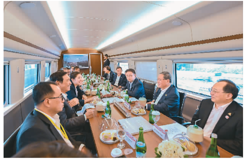
当地时间9月6日下午，正在印度尼西亚访问的国务院总理李强考察中印尼合作项目雅万高铁。印尼对华合作牵头人、统筹部长卢胡特，交通部长布迪陪同考察。

李强随后试乘雅万高铁并考察了卡拉旺站站建设情况。他表示，高铁铺就的是一条融合之路、开放之路、共富之路，不仅缩短了城市间的时空距离，还会带动产业结构优化升级，为沿线经济发展赋能。中方愿同印尼分享成熟经验，共同做好高铁兴业兴城这篇大文章。李强指出，中印尼两国经济互补