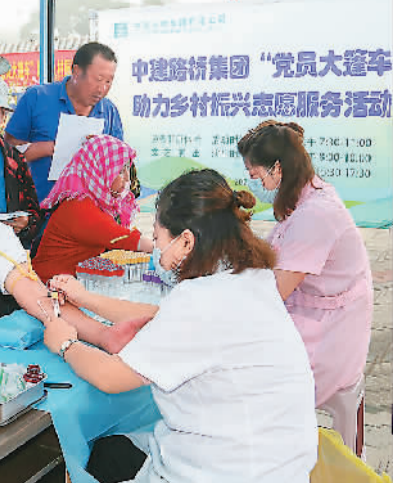
中建路桥集团“党员大篷车”助力乡村振兴志愿服务活动