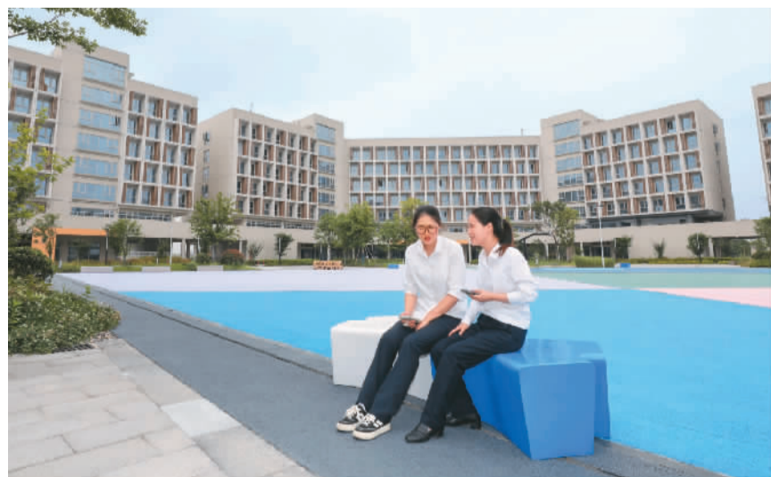
近年来，浙江省绍兴市上虞区紧盯人才创新创业需求，做优做实人才发展支持政策，强化人才服务保障，今年在“e游小镇”推出“零元入住”青春公寓，新入职大专及以上学历青年可享受3年租金优惠政策。图为入住青春公寓的青年在交流。

新进展，并表示将依据有关规定研究中止或部分中止ECFA项下给予台湾产品的关税优惠。请问有何评论？朱凤莲作上述回应。 她介绍，商务部对贸易壁垒调查的初步调查结果显示，民进党当局单方面限制大量大陆产品输入，涉嫌违反世贸组织关于“非歧视原则”“普遍取消数量限制原则”等规则，损害了大陆相关产业和企业利益，同时也损害了台湾消费者利益。参与调查的两岸企业和商协会呼吁台湾地区尽快取消对大陆的贸易限制措施。