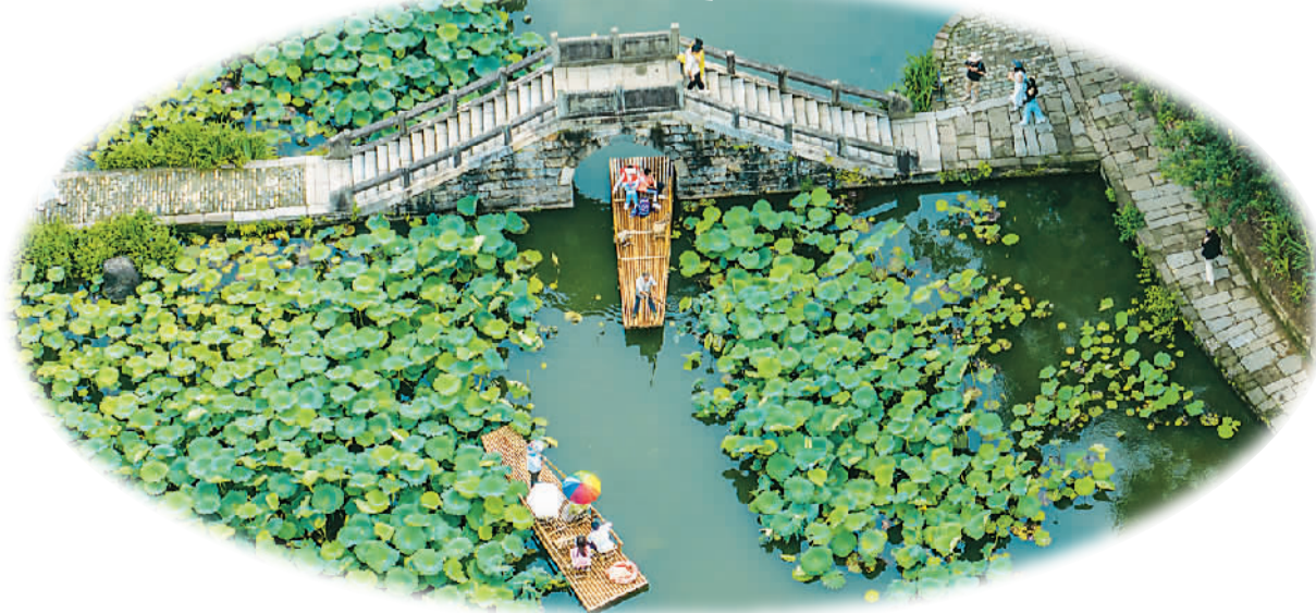
在安徽省黄山市徽州区呈坎古村，游客乘坐竹筏在村口的永兴湖上赏荷游玩。