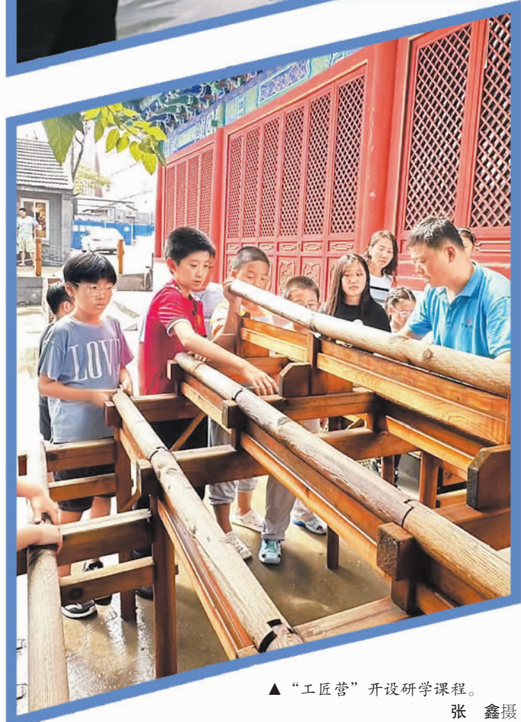
“工匠营”开设研学课程。

满了金银花；还有的小微花园直接以居民的名字命名，激发了居民认养绿地的积极性……”张志勇说，在东四街道，只要不影响邻里生活，不妨碍周围交通，居民可以尽情发挥自己的想象力，装点胡同微花园。能在老胡同里拥有精致的小花园，设计建造之初还融合了居民自己的想法，街坊们都格外珍惜，还成立了“花友汇”，以花为媒，以花会友。