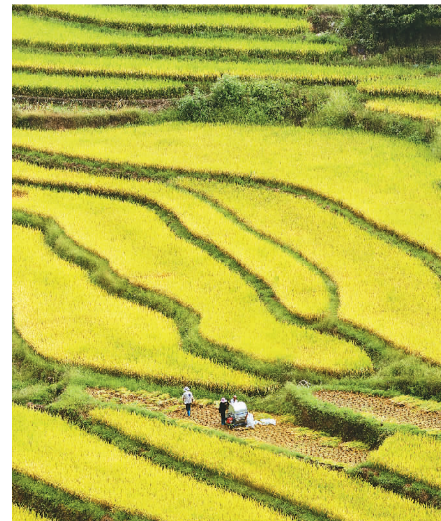
近日，湖南省郴州市嘉禾县晋屏镇宅侯村600多亩高山优质稻迎来成熟丰收期，橙黄稻浪与层叠梯田相互映衬，构成一幅高山乡村丰收景观图。图为村民在梯田上收割中稻。

中国科学院地理科学与资源研究所研究员张文忠认为，中高端自行车能够满足各种户外活动锻炼需求，给自行车产业转型和高质量发展带来了新机遇。“与上世纪七八十年代的骑行潮相比，自行车的代步功能和时尚性并没有变化。但如今，骑行的健身和运动属性更加凸显，绿色出行的理念更加深入人心。这些反映出中国经济社会发展水平和人们生活水平不断提升。”张文忠说。