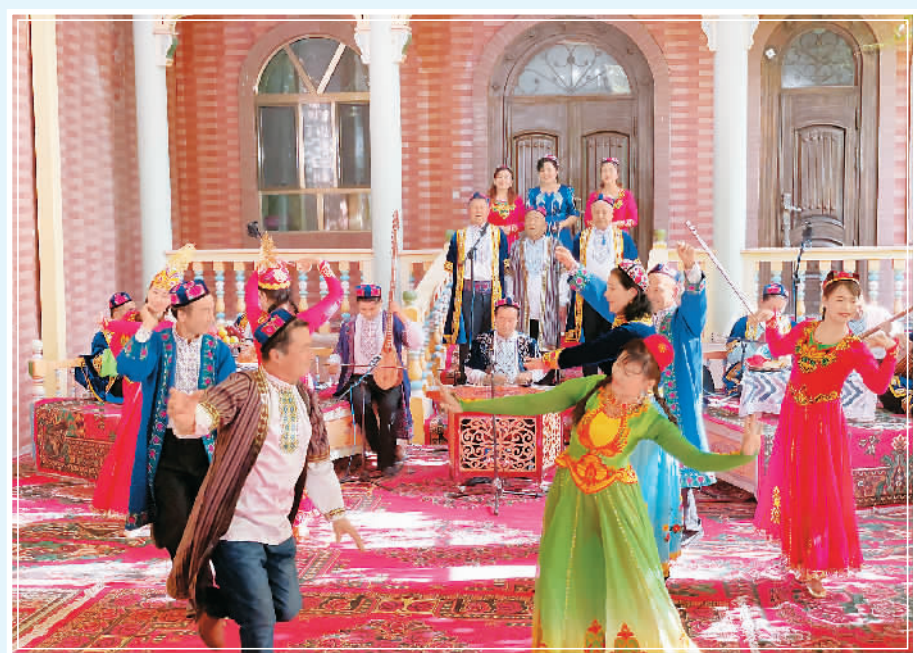
民间艺人载歌载舞。