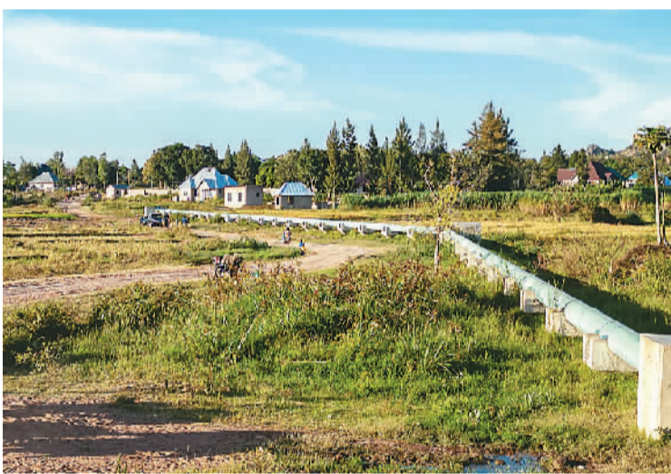
▲姆万扎省萨哈的供水项目输水管道。