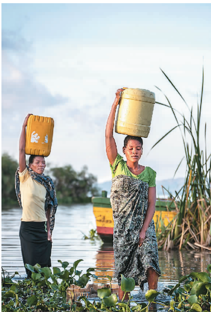
▲村民在坦桑尼亚姆万扎省维多利亚湖畔打水。在姆万扎省输水工程尚未覆盖区域，部分居民仍使用旧有方式取水。