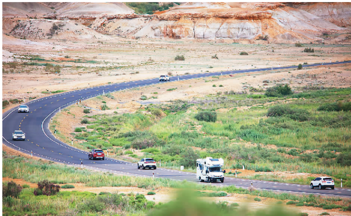
自驾游车辆行驶在新疆维吾尔自治区阿勒泰地区福海县环湖观光路上。

多家在线旅游平台的统计显示，今年暑假，成都、乌鲁木齐、三亚、海口、昆明、大理、贵阳、西安、西