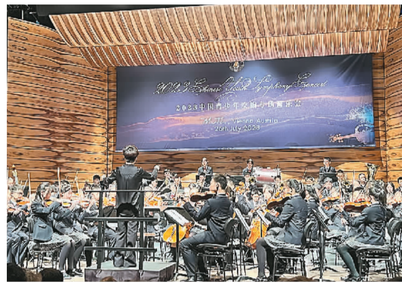
北京少年金帆管弦乐团的小音乐家们在奥地利维也纳MuTh音乐厅演出。

此次交流活动由众信教育——游学·留学承办，它作为众信旅游集团旗下专注于教育的品牌，多次组织各项大型音乐节活动，为中国青少年提供教育、艺术等国际文化交流活动，让他们在旅行中了解世界。