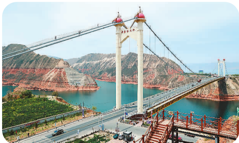
甘肃临夏的刘家峡大桥成自驾游网红打卡地。

大湖深处的微山岛镇正采取“农旅+”“文旅+”的模式，打造“农旅小镇·文旅微山岛”旅游品牌；不少沿湖村庄全力实施“山东手造·微山优品”工程，培育了淘湖网、荷乡等一批文创产品。当地还开发和推介湖区特色美食，举办“中国鲁菜·微山湖美食节”，打造微山湖特色文旅餐饮品牌。