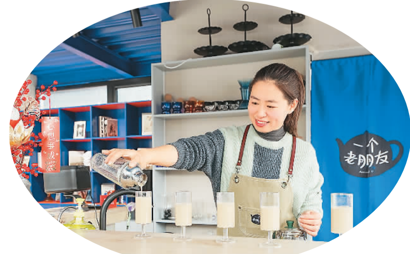
80后孙乾自主创业，经营北京一家民宿。

“这里不仅是红色旅游胜地，还有很多历史文化遗迹。”微山县文旅局有关负责人介绍，位于微山岛上的殷微子家古风犹存，汉留侯张良依山傍水，乾隆下江南题匾至今悬挂在微山岛古店铺门楣……2022年，