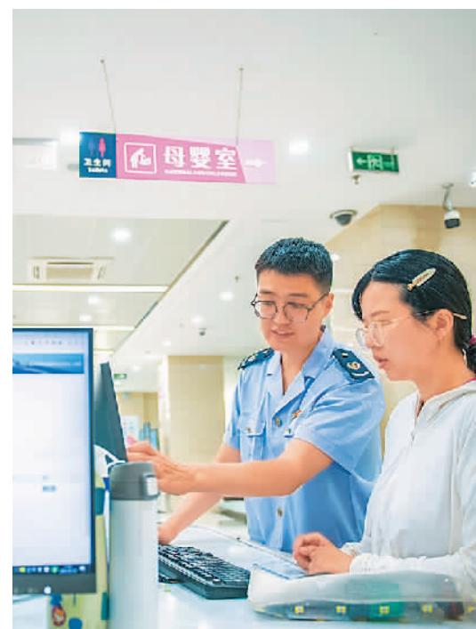
在江苏省宿迁市宿豫区办税服务厅“线上体验区”，税务工作人员指导纳税人体验“线上办”智能化纳税服务项目。

专家认为，让税收服务更智慧，还需充分依托税收大数据。有关部门应完善税收大数据云平台，加强数据资源的开发利用，充分运用云计算、人工智能等技术，进一步推进征收管理数字化升级和智能化改造。