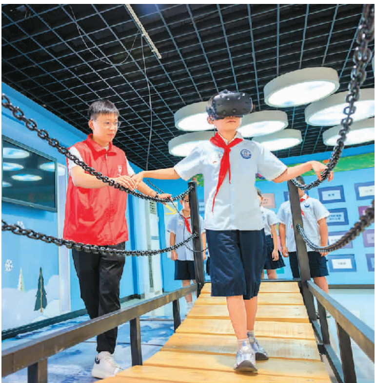
近日，安徽省合肥市庐阳区林店街道景湾社区组织辖区小学生走进合肥市气象馆，参观体验各种科普展览和趣味科普游戏，感受科技的魅力。图为在合肥市气象馆，来自景湾社区辖区的小学生正通过VR眼镜体验气象灾害避险。