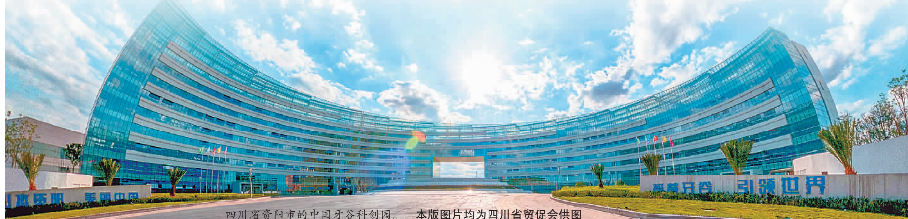
四川省资阳市的中国牙谷科创园。