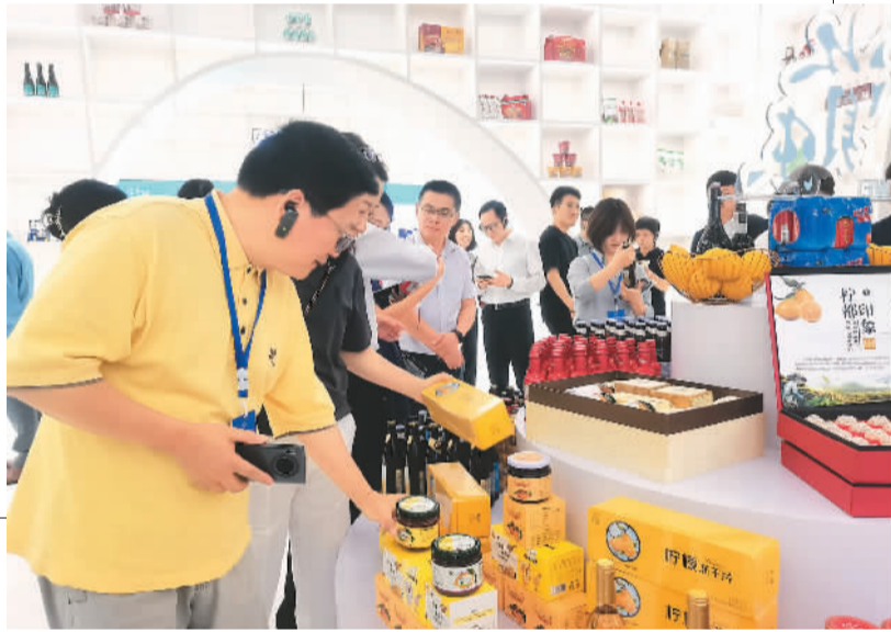
▶“外资企业四川行”企业代表在实地考察。

也持续攀升。他甚至期待着，再过10来年自己退休时，中国分公司的规模能赶上德国总部。