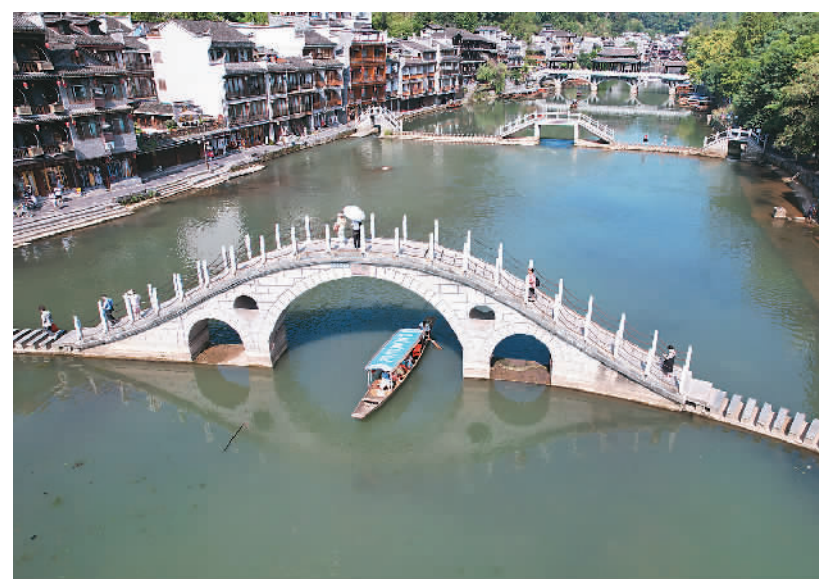
近期，湖南省湘西土家族苗族自治州凤凰古城迎来暑期旅游高峰，各地游客来到古城沱江沿岸参观游览、泛舟沱江，乐享清凉，快乐度假。

务。卫生健康部门要发挥专业优势，落实出生缺陷防治职责，主动组织基层医疗卫生机构、妇幼保健机构、儿童医疗机构等面向育龄妇女、孕产妇、儿童家长等重点人群开展相关宣教，同时，做好基层医务人员、妇幼保健人员、儿科医疗人员的残疾儿童康复救助等政策培训。民政部门、妇联等要积极利用所属服务阵地，开展新婚夫妇、育龄妇女、儿童家长等人群的针对性宣教。