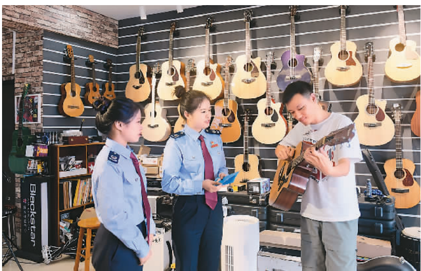
近日，国家税务总局仁怀市税务局高坪分局工作人员来到贵州省仁怀市小巷子文化传媒有限公司开展政策宣传辅导，解答疑难问题、指导纳税申报。该公司自开业以来享受各项小微企业税收优惠。图为税务人员在了解公司情况。

长13.9天。据介绍，全国法院认真贯彻总体国家安全观，依法惩治各类犯罪，审结刑事一审案件54.5万件，同比增长10.88%，平均办案用时同比减少5.11%。全国法院充分发挥民事审判定分止争、促进社会公平正义的职能作用，审结民商事一审案件805.3万件，同比增长7.90%。全国法院坚持能动司法，推动行政纠纷源头解决、综合治理，审结行政一审案件13.2万件，同比上升2.11%。