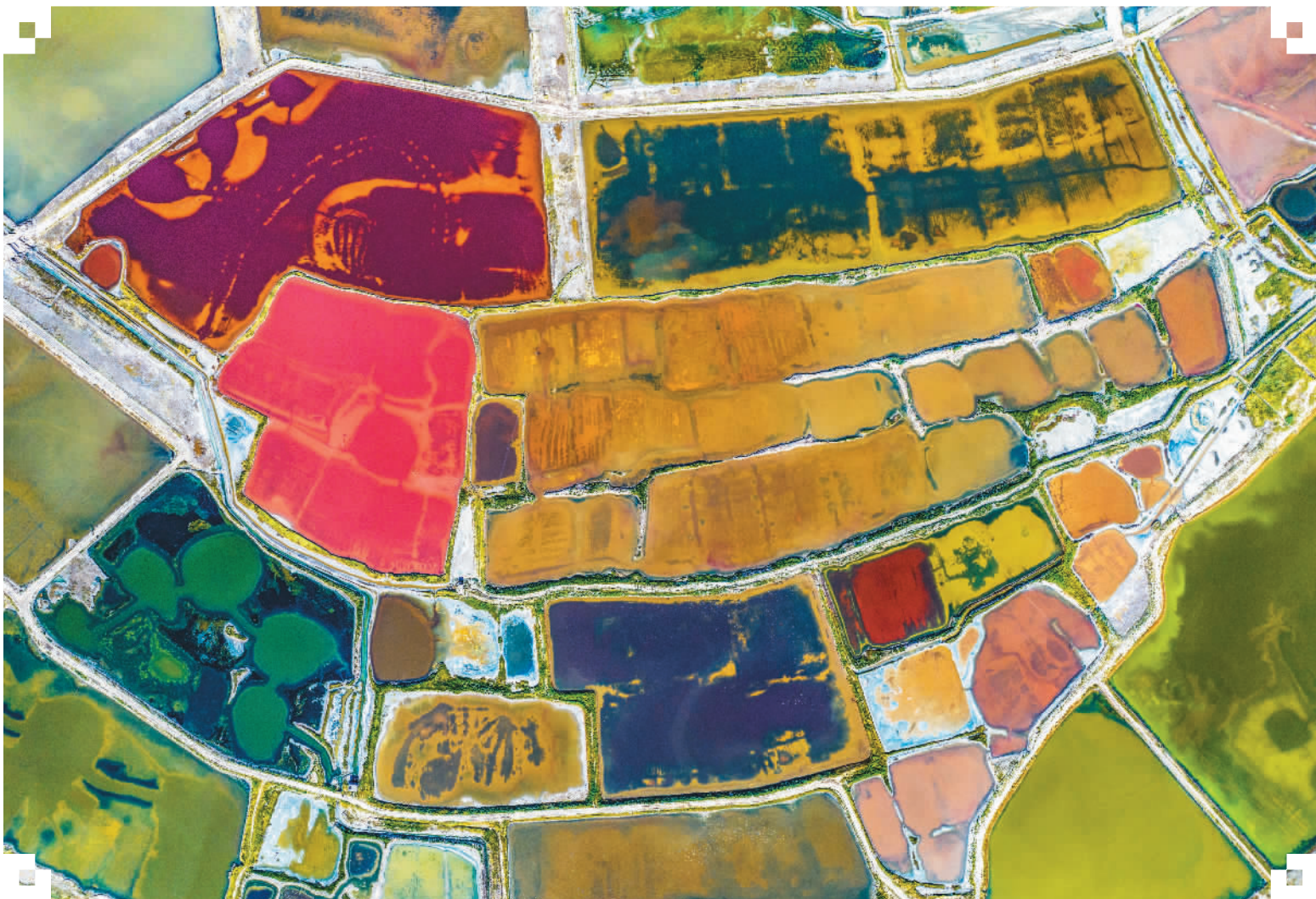
近日，随着气温的升高，山西省运城市七彩盐湖呈现出色彩斑斓的靓丽美景。图为八月七日拍摄的盐湖美景。