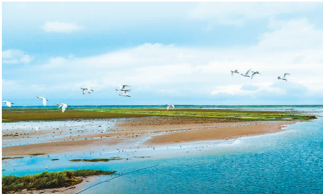
盛夏时节，江苏省东台市沿海，蓝天碧水，候鸟频飞，麋鹿嬉戏，构成一幅幅人与自然和谐共生的美丽画卷。图为黑琵琵在湿地飞翔。

自2019年11月起，《大众摄影》杂志社与条子泥连续合作举办了4届全国摄影大展和六期“聚焦条子泥 摄影欢乐汇”摄影训练营，有效推动了条子泥旅游产业的发展。本次活动一方面向社会推介条子泥湿地独特的优质自然景观、丰富的物种和环境保护成果，让条子泥湿地走进百姓视野；另一方面也为摄影人提供了一处大展身手的“创作天堂”。