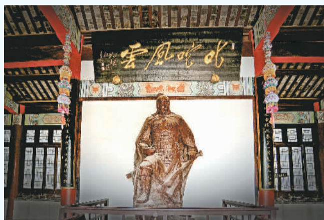
左下：享殿中的西楚霸王像。