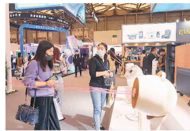
参观者在中国家电及消费电子博览会现场体验智能家居新产品。马伟勤摄（人民视觉）