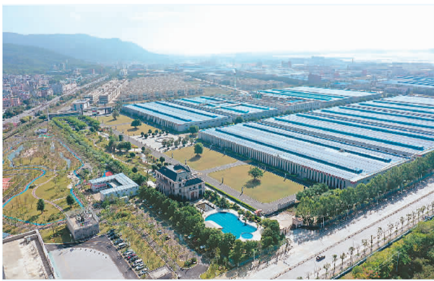
中印尼“两国双园”福州元洪投资区一角。