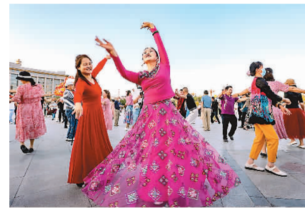
人们在新疆乌鲁木齐南市民广场跳广场舞。