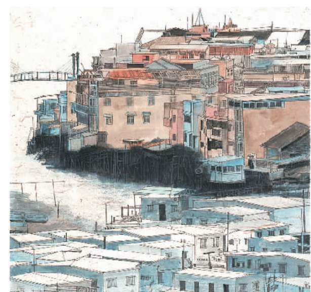
▲ 港·大澳渔村 (中国画) 潘鲁生