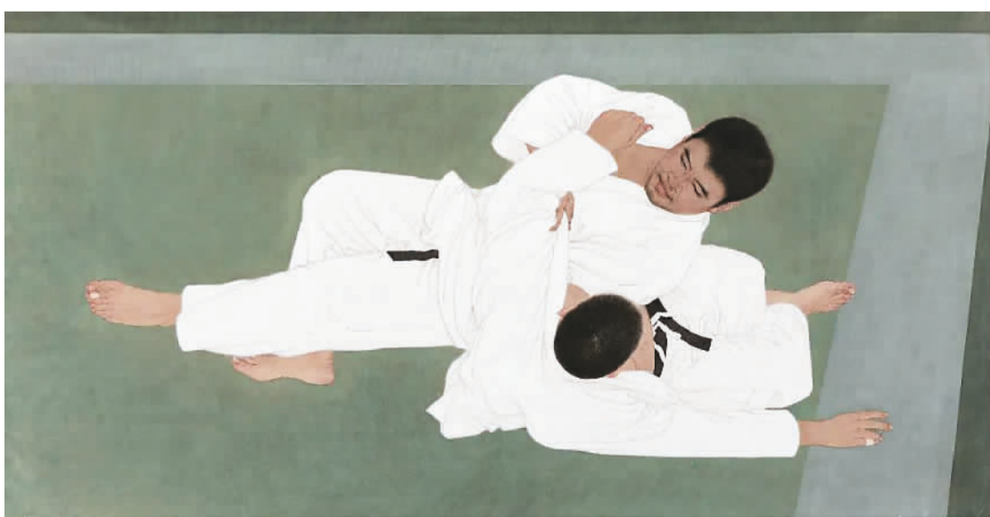
▲ 较量 (中国画) 陈治、武欣