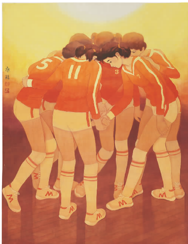
▲ 决战之前 (中国画) 徐启雄

的剪影，让人印象深刻。2017年，陈治和武欣合作的工笔画《较量》，聚焦摔跤运动，用线描辅以晕染，勾勒出两位摔跤运动员力量相互抗衡的瞬间。