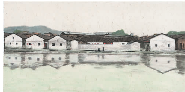
▲ 粤·国龙屋 (中国画) 潘鲁生

近年来，我一直在粤港澳大湾区进行民艺调研，走了不少乡村社区，到过许多工厂码头，总被这块年轻又古老、富饶又神奇的土地打动，拍了不少图片，画了一些写生，即时记录所见所想。大湾区的传统村落和传统工艺，具有历史与当下、本土与世界、经济与文化交汇共生的意义。身处国家经济发展、改革开放的前沿，昔日的传统村落、民间艺术作为文化传统的根脉，依然在日常生活的语境中延续和发展着，其中包含着很多耐人寻味的主题，可观，可思，可画。透过形象，可以体会其中悠远绵长的人文精神和文化内涵。