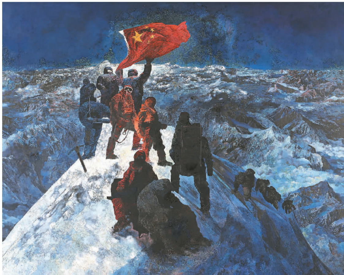
▲ 征服珠峰 (油画) 冯杰

表现体育竞技，雕塑的形式感具有显著的特点。1985年，田金铎创作出富有时代象征意义的雕塑作品《走向世界》。为了表现女竞走运动员最具动感和力量感的瞬间，作者充分发挥抽象艺术的创造力，在艺术语言和形式上吸收了西方现代主义手法，整体的块面结构极具形式美，并把底座处理成“0”字形，既表现了竞走姑娘步履的轻灵，又象征着中国在奥运赛场上“零的突破”。1989年，俞畅创作的雕塑《挑战》，则刻画了一位残奥会上的铁饼运动员。作品中，运动员旋转着身体摆动铁饼，定格正准备投掷出去的那一瞬间。相较于田金铎雕塑作品形态的流畅，俞畅则是让运动员的身体处于最紧张、力量即将释放的那一刻，扭转、倾斜，惊心动魄，运动员身体的肌肉紧绷着，突出的线条正好成