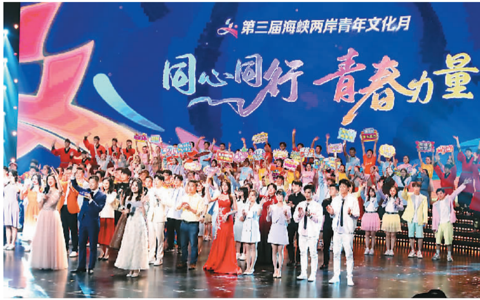
图为第三届海峡两岸青年文化月开幕式上，两岸青年共同唱响《青春的海》。

本届青年文化月从7月下旬持续至9月中旬，开幕式及主场活动在江苏省苏州市举办。活动以“同心同行 青春力量”为主题，旨在交流中华文化创新发展，讲好文脉传承新鲜故事。近1500名台湾青年参加相关活动。