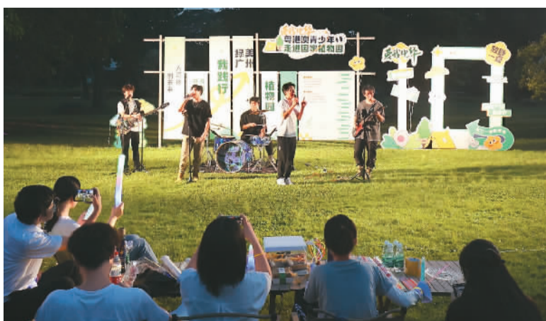
图为音乐派对上，粤港澳三地青少年在草坪上随乐而唱。

据新华社广州电（记者胡拿云）夏日之夜的荧荧星光、音乐派对上的欢聚畅谈、经典传唱的粤语歌曲……近日，来自粤港澳大湾区的50位青少年相聚位于广东广州的华南国家植物园，欢度游园会。