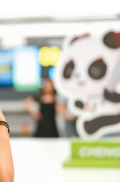
成都天府国际机场内，抵蓉的巴西代表团成员在等候行李时拍摄机场内的大运会吉祥物“蓉宝”装饰。新华社记者 晋冰洁摄

巫山地处三峡库区水土保持功能区、秦巴生物多样性生态功能区。近年来，重庆市巫山县呵护绿水青山的同时深挖经济效益，正把生态优势持续转化为高质量发展的优势。