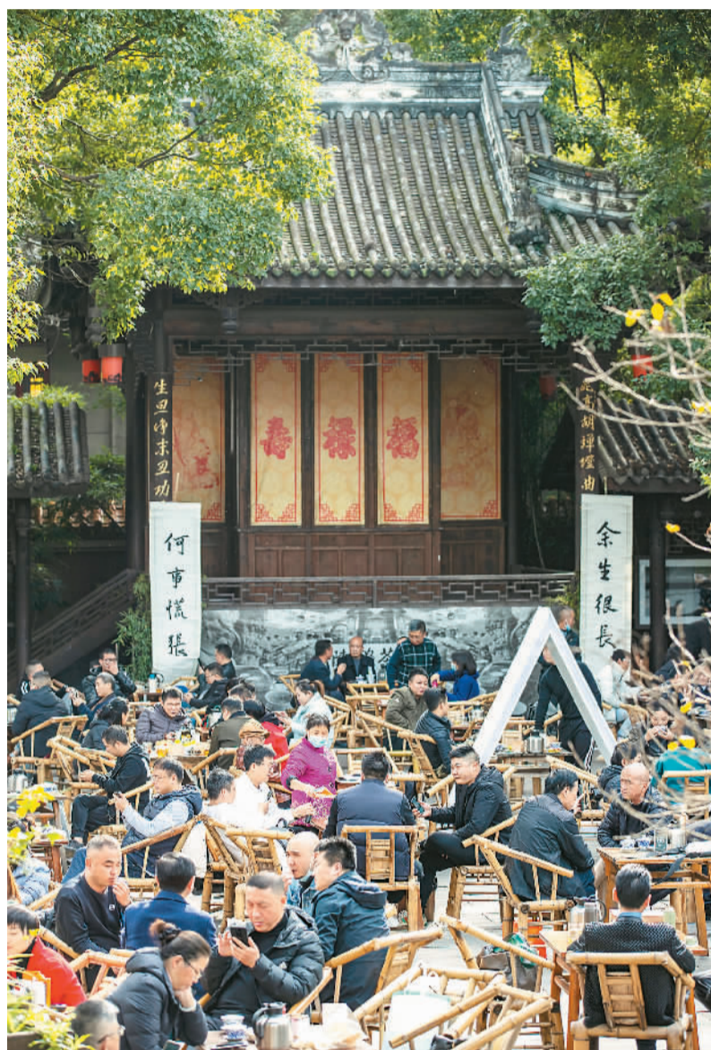
人们在成都铁像寺水街的陈锦茶铺喝茶。

大运会的举办增强了成都旅游的吸引力。飞猪数据显示，大运会期间成都进出境的国内机票预订量同比增长约2倍，火车票预订量同比增长超5倍。多家在线旅游平台的数据显示，从景区景点的搜索和预订量看，成都大熊猫繁育研究基地、杜甫草堂、都江堰、金沙遗址博物馆、青城山、武侯