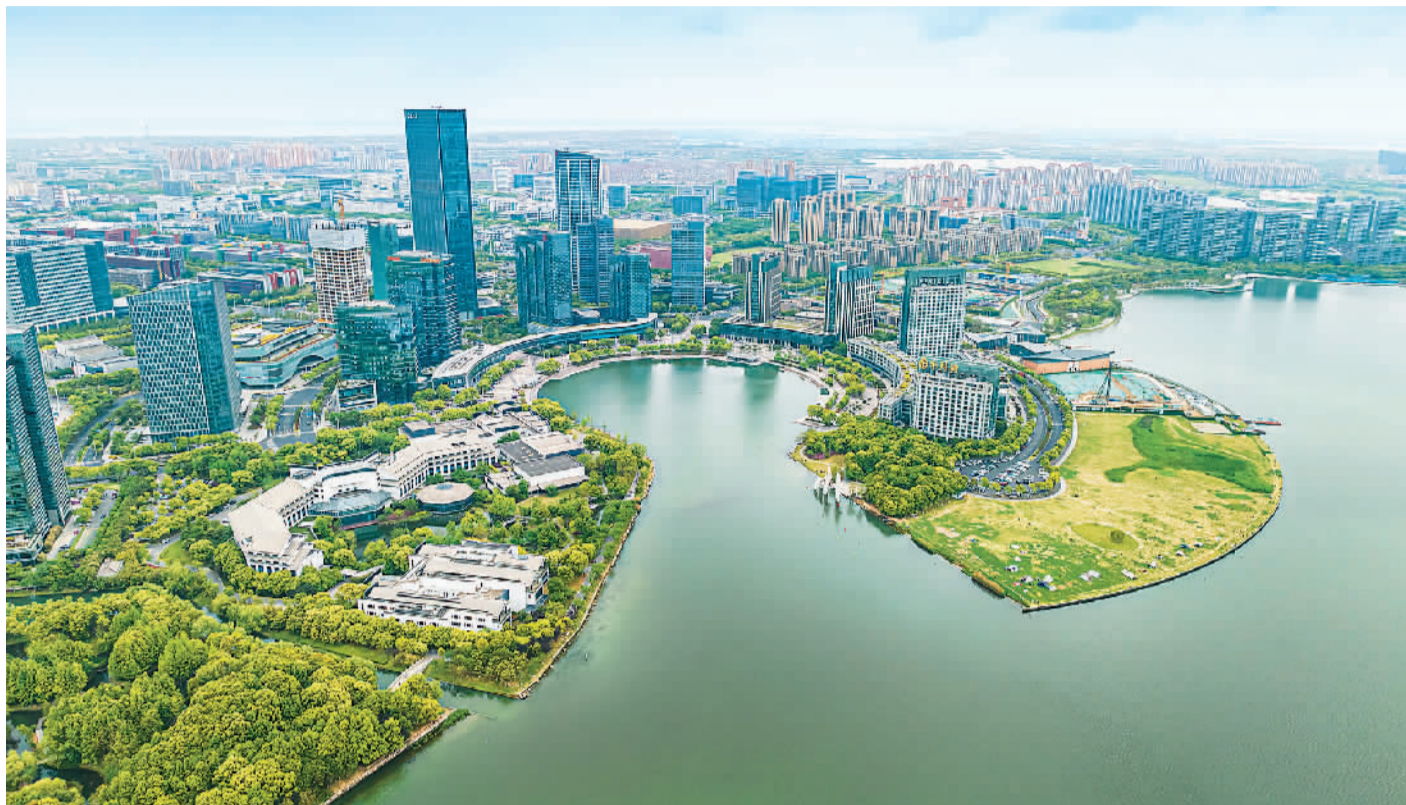
江苏自由贸易试验区苏州片区一景。

曾经，境外非居民纳税人跨境缴纳税款必须在境内开设银行账户或跨境汇款缴税，耗时长、成本高，有时还要出入境；如今线上操作，只要几分钟就可以办完所有手续——这一改变，得益于“跨境人民币全程电子缴税”改革。近日，这项在广东自贸试验区试点的改革举措正式在全国范围内复制推广。