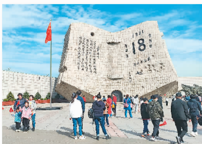
辽宁省沈阳市“九·一八”历史博物馆残历碑广场。