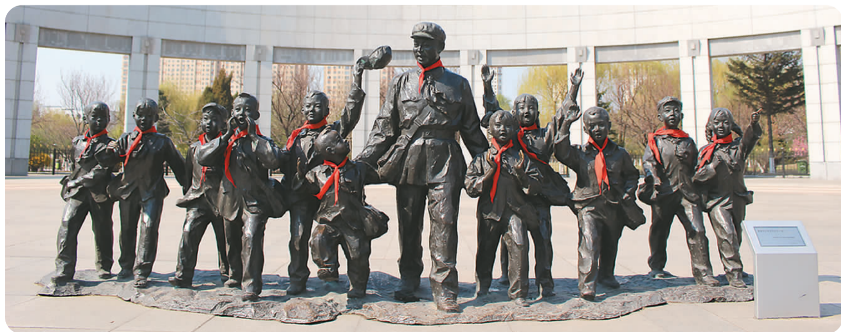
辽宁省抚顺市雷锋纪念馆广场上的雕塑。