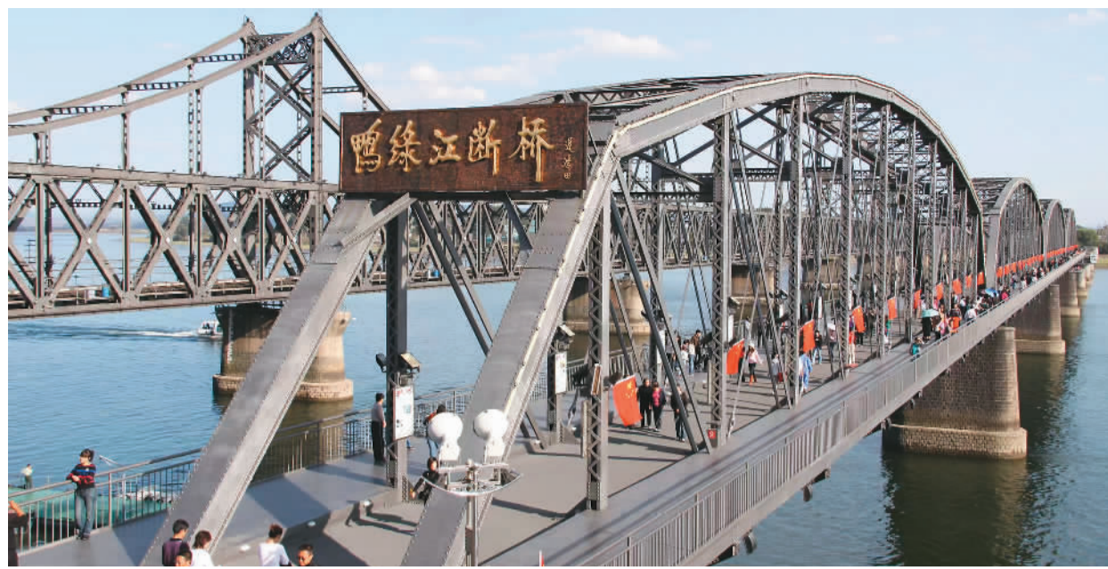
节假日期间鸭绿江断桥红旗飘扬。