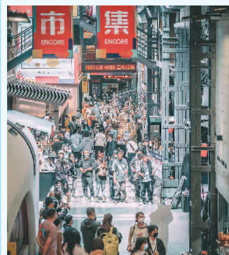
游客在沈阳1905文化创意园犀牛长街观看“无边界舞台”演出。