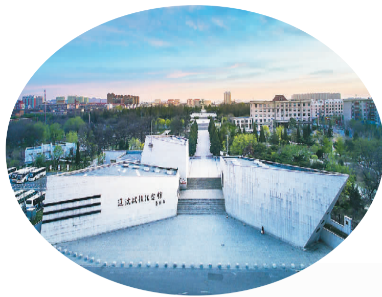
辽沈战役纪念馆外景。