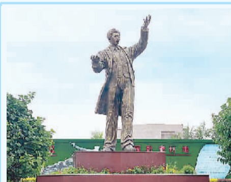
辽宁省朝阳市建平县朱碌科镇聂耳广场聂耳雕像。朝阳市建平县朱碌科镇政府供图