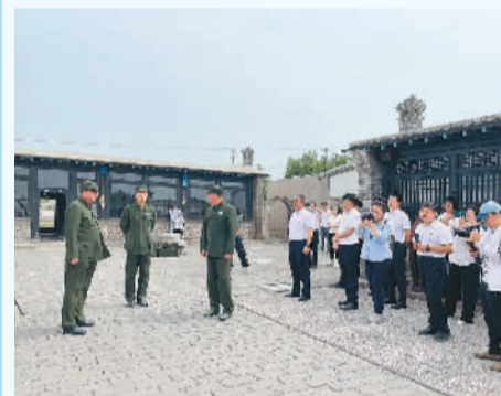
游客在东北野战军锦州前线指挥所旧址观看《历史的瞬间》情景剧演出。