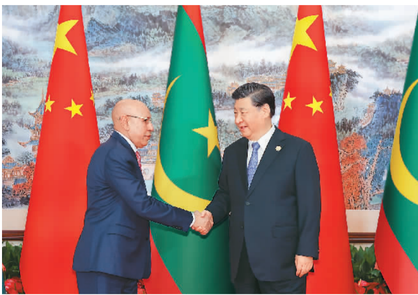
7月28日下午，国家主席习近平在成都会见来华出席第31届世界大学生夏季运动会开幕式并访华的毛里塔尼亚总统加兹瓦尼。