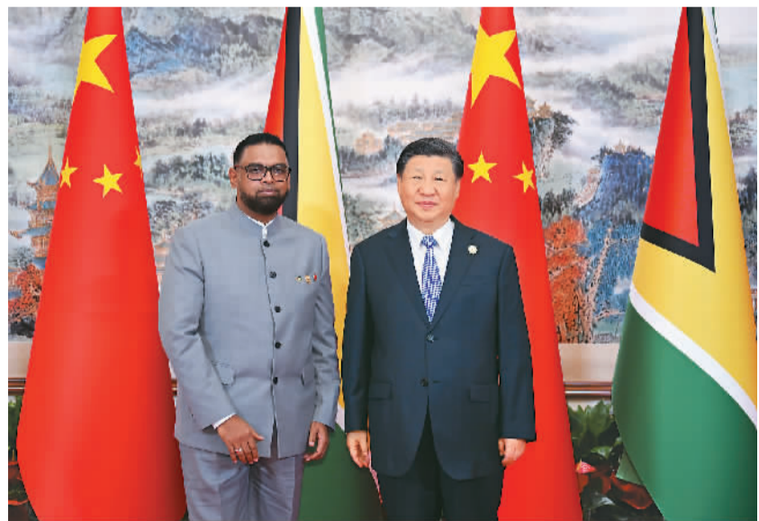
7月28日上午，国家主席习近平在成都会见来华出席第31届世界大学生夏季运动会开幕式并访华的圭亚那总统阿里。

习近平指出，2013年我首次访问加勒比地区，同加勒比9个建交国领导人一道确立中加全面合作伙伴关系。中方一贯支持加勒比国家团结自强、发展繁荣，愿同加方携手构建更加紧密的中加命运共同体。希望圭方继续