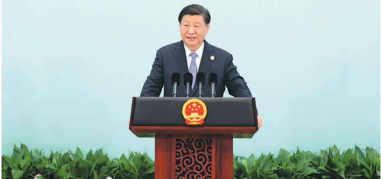
7月28日中午，国家主席习近平和夫人彭丽媛在四川省成都市金牛宾馆举行宴会，欢迎出席成都第31届世界大学生夏季运动会开幕式的国际贵宾。这是习近平发表致辞。