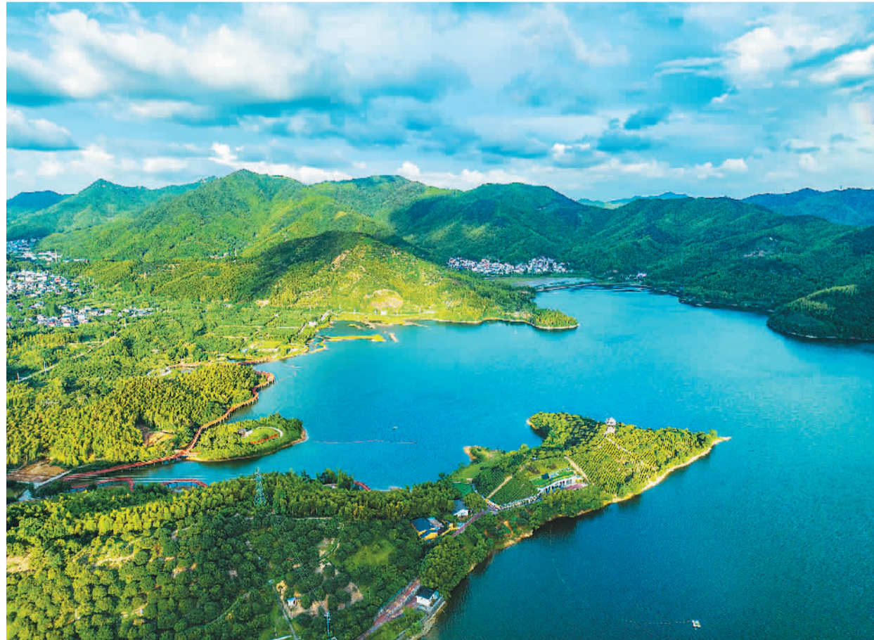
浙江省宁波市江北区慈城镇南联村充分发挥三面环山、一面临水的自然环境优势，发展乡村休闲旅游，依山傍水建设观景休闲平台、健身绿道、山地车越野公园等，增加了村民收入，助力乡村振兴。图为7月26日，山清水秀的南联村。