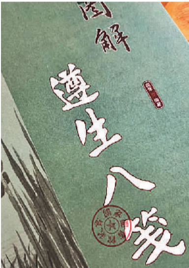
《遵生八笺》封面。

该书内容包括医药卫生、气功导引、饮食起居、山川逸游、花鸟鱼虫、琴棋书画、笔墨纸砚、文物鉴赏等广博的知识，论述了身心调养、性情陶冶、生活调摄、卫生保健、疾病防治、气功修炼、艺术欣赏等却病延年、养生防病的方法与知识，取材精当，方法实用，文笔隽永，意趣高雅，不仅可使读者增长养生知识，也可增长文学