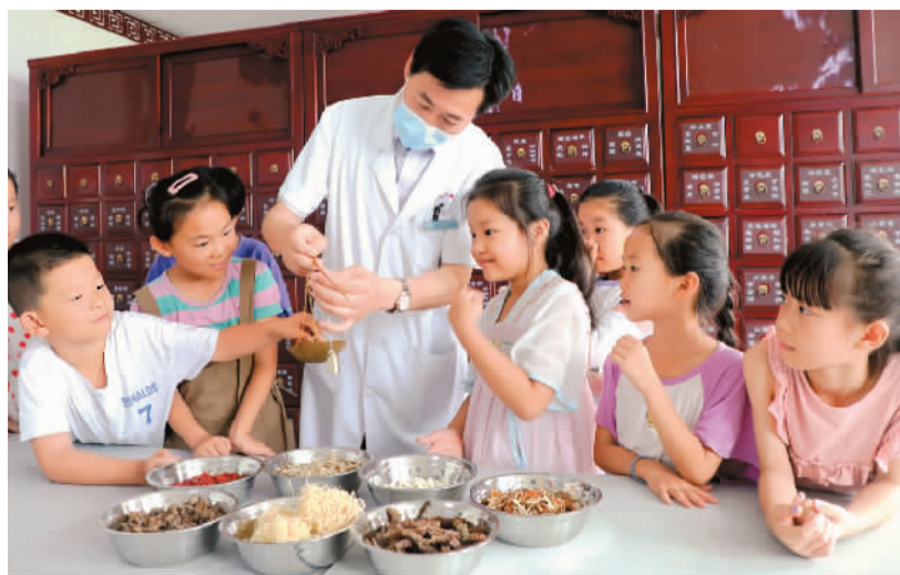
日前，山东省东营市东营区史口镇萤火虫学堂学生来到史口中心卫生院中药房学习中医药知识。在医师指导下，学生“零距离”学认中草药，了解中医药知识，感受传统中医药魅力。

李小龙在电影《猛龙过江》中被人质疑：“听说中国拳花巧很多，都是软手软脚的，是不是？”他回应道：“任何拳术练得不好，都是软手软脚的。”对中西医，亦当如是观。