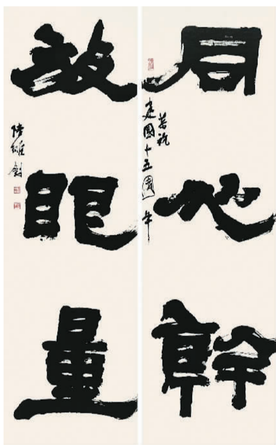
▲ 同心干，放眼量（隶书）

一甲子以来，中国高等书法教育的薪火在几代书家共同努力下，逐渐播撒到全国各大高校，不断发展壮大，直至今日已蔚为壮观。各层次学历学位教育从