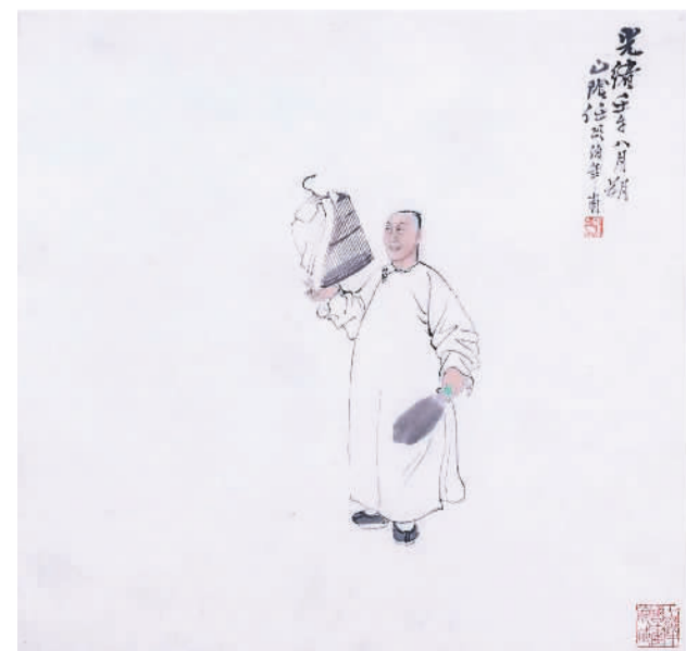
▲ 清代人物写生（中国画）

展览分为“俗世纷呈”“与古为新”“道释瑞彩”三个版块，包括《陈玉璞像》《清代人物写生》《东山丝竹》《簪花曳杖》等作品。主办方表示，展览不仅展示明清人物画，还探讨明清人物画史对后世，尤其是对当下人物画创作的影响。这些人物画中所凝聚的人文精神，或将为观众带来不一样的视觉享受和心灵体验。