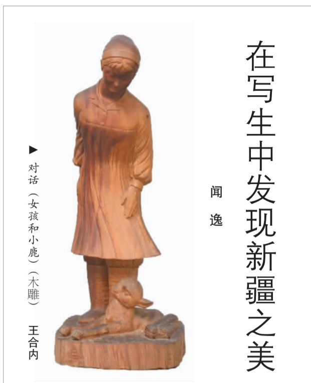
▲ 对话（女孩和小鹿）（木雕） 王合内

20世纪以来，中国一代代艺术家远赴新疆写生，创作出一大批美术佳作。日前，由中央美术学院主办的“写生新疆：20世纪以来新疆主题创作研究展”在中央美术学院美术馆举办，集中展示了中国20世纪以来具有代表性的新疆主题美术作品，呈现了几代艺术家笔下的新疆之美。