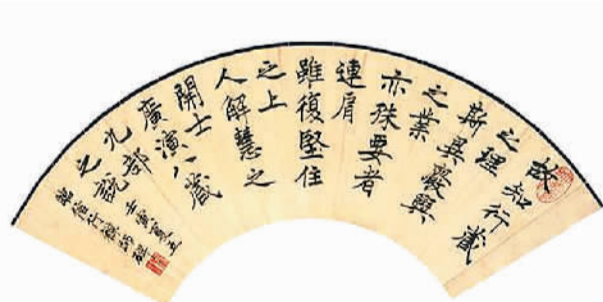
▲ 临薛稷信行禅师碑（楷书）