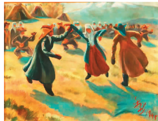
▲ 天山脚下歌舞（油画）

地处丝绸之路上的新疆，具有独特的人文景观和地理景观。这是吸引和启发众多艺术家深入新疆进行创作的缘起。20世纪后半叶，大批受过现代艺术语言训练的艺术家沿着前人的足迹，不断走进新疆腹地，重新认识中国山河的壮美奇雄。他们在汲取文化养分的同时，也开始重新思考文化艺术的价值。通过对“写生新疆”的课题性研究，既展现了这片广袤土地在新中国成立以来发生的巨大变化，也以此主题为视点，领略中国20世纪以来艺术观念和创作思想的发展脉络。