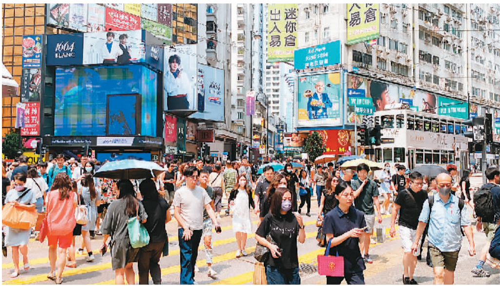
香港街头车水马龙，人气畅旺。

新一届特区政府成立后，李家超在任内首份施政报告中提出多项推动创新发展、吸引重点企业