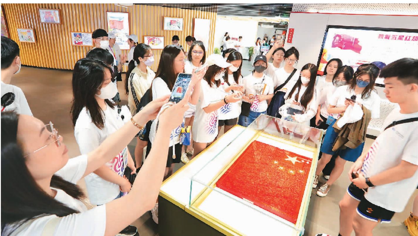
“同心迎亚运·携手向未来”港澳青年浙江行活动日前启动，活动由浙江省委统战部、香港浙江省同乡会联合会、澳门苏浙沪同乡会等共同举办。图为在浙江省瑞安市委统战部的安排下，港澳青少年走进瑞安国旗教育馆，聆听国旗诞生历程的讲解。