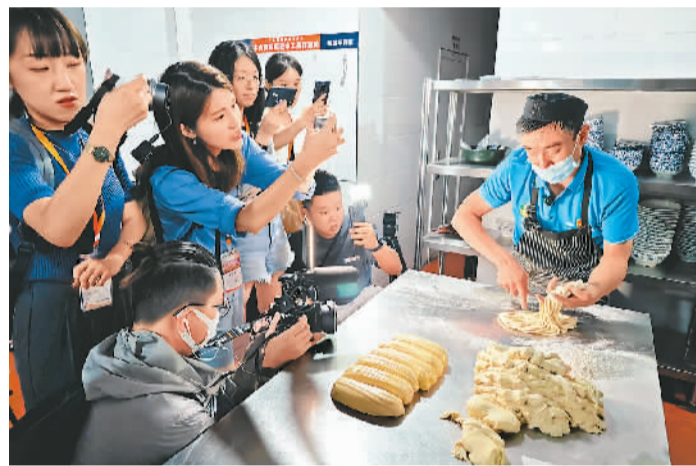
图为两岸记者在兰州牛肉面博物馆参观。

据介绍，采访团此行将前往甘肃省博物馆、武威古浪黄花滩、富民新村、张掖山丹军马场、巴尔斯雪山、丹霞地质公园等地进行采访，还将走访扎根甘肃发展的台湾青年。活动将持续至7月24日。