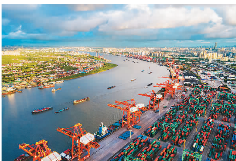
7月17日,上海天气晴好,黄浦江上船只往来穿梭,张华浜码头装卸繁忙。

“爱达·魔都号”总吨位达13.55万吨,拥有2826间舱室,可容纳6500多人,被誉为“移动的海上城市”。根据计划,该船将于今年年底命名交付。