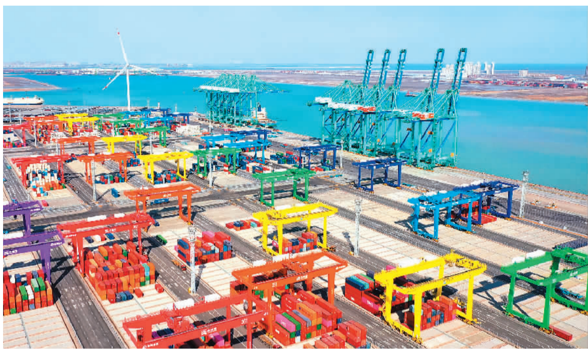
图为天津港全物联网集装箱码头(无人机照片)。

联合国贸易和发展会议日前发布《2023世界投资报告》显示,2022年中国吸引的外国直接投资额增加5%,达到创纪录的1891亿美元。对此,外媒认为,在世界经济面临多重挑战的背景下,中国吸引外国投资逆势增长,说明中国市场吸引力巨大,也再次表明世界向中国经济投下“信任票”。