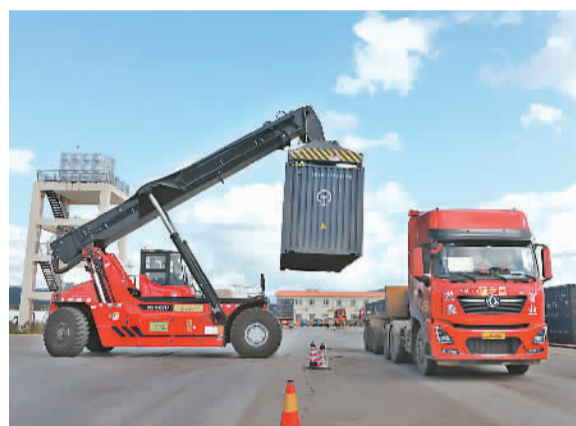
图为在位于云南省景洪市境内的中老铁路野象谷站货场,工人吊装集装箱。

共建“一带一路”倡议对东盟很重要。自2000年以来,东盟一直是与中国共同发展的区域经济体。中国的人口大约是东盟国家人口总和的两倍,经济规模也更大。中国西南与许多东盟国家接壤,也促成了许多正在推进的项目。在老挝,中国正在为一条连接老挝首都万象和中国西南部城市昆明的跨境铁路提供资金。得益于中国投资,柬埔寨也有高速公路、通信卫星和国际机场项目正在推进。在东帝汶,中国投资修建了高速公路、港口,中企还中标了东帝汶国家电网的运维项目。印尼的公共交通和铁路也受益于共建“一带一路”倡议。越南也有了一条新的轻轨线路。自上世纪80年代末以来,中国对缅甸的投资额在外国投资中居首位。新加坡不仅是共建“一带一路”倡议的合作伙伴,也是亚投行的创始成员国。在全球经济增长低迷的背景下,大多数东盟国家将共建“一带一路”倡议视为完善基建和促进国内经济的机会。——据新西兰“新闻编辑室”网站报道