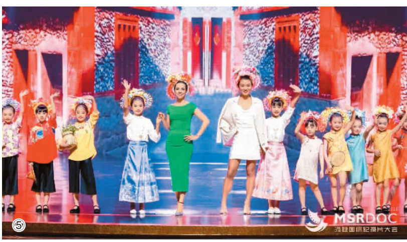
图⑤：海内外纪录片从业者在泉州欢聚一堂。

“熊猫在观察”还设有“品四川”“故事汇”“放映室”3个单元，这些单元将带领观众了解当下发生在四川的热点事件，展示四川的自然地理风貌、历史文化景观、人文美食民俗等；通过微纪录的形式、故事化的叙事方式，以国际视角展示四川的活力与魅力，开放与包容；通过视频集锦的方式，推介四川悠久的历史文化和当下生活的烟火浪漫、安逸快乐。