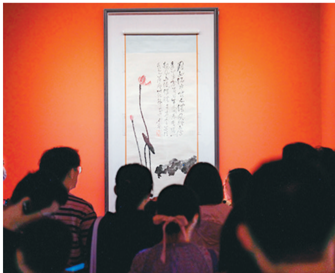
▲观众在展览上欣赏名家名作。