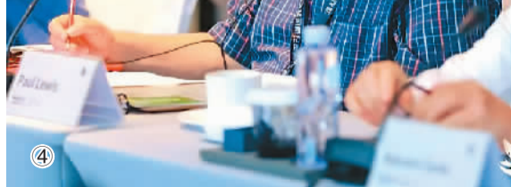
图④：不同国家的纪录片从业者交流研讨。

日本东京纪录片提案大会主席天城鞠彦从事纪录片制片工作已有50多年。他认为，每个国家都有自己制作影片的方式，西方世界的叙述风格与日本就大相径庭。西方国家讲故