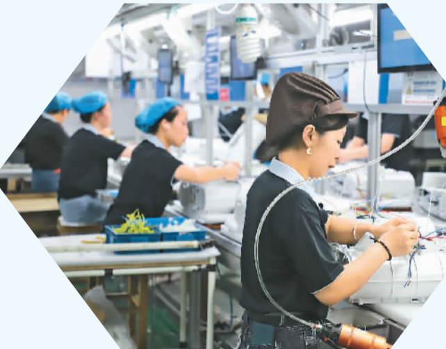
▲工作人员在鼎安电器有限公司车间组装净水器。