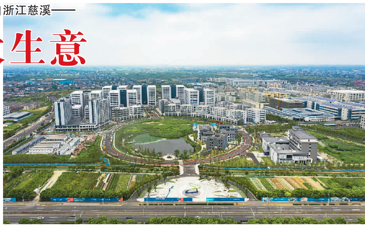
慈溪小家电智造小镇一瞥。