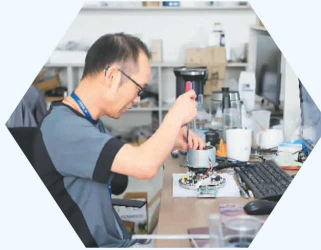
▲凯迪利电器有限公司研发车间内，一名研发人员正对咖啡机进行功能测试。