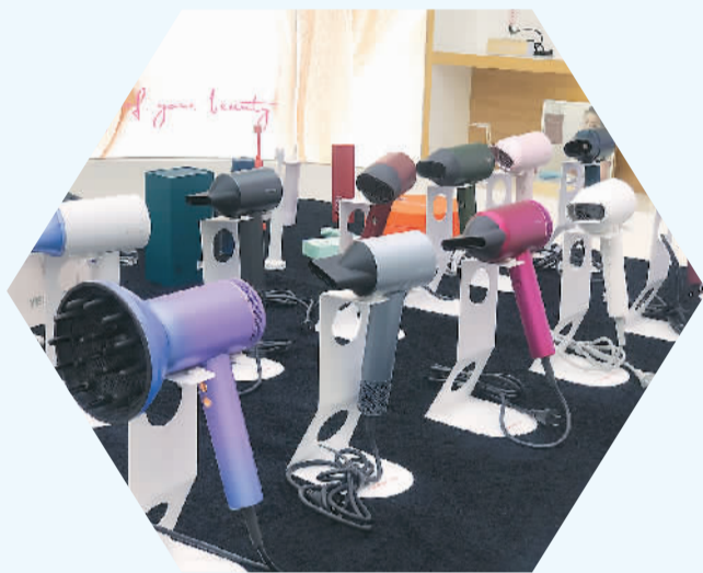
▲月立自主品牌“小适”吹风机。

徐剑辉回忆起1999年参加德国科隆国际家电展的情景，卓力自主研发的新品电熨斗一经亮相即在展会上引起关注，精妙的原创设计让不少外商要求与卓力当场签约，打破了当时外界对于中国小家电“只会模仿国外产品设计”的偏见。如今，卓力已建成“产研销”全链条，集团200多名工程师每年推出创新产品上百款。