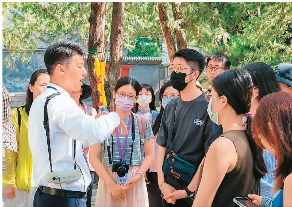
参加台胞青年夏令营的青年在北京市颐和园内聆听讲解员讲解。

长城行程结束后，营员们来到位于北京中轴线北延长线东侧的中国共产党历史展览馆，解锁中国近代以来从“站起来”“富起来”到“强起来”的发展密码。