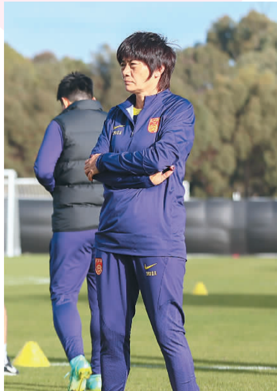
水庆霞在训练中。

7月20日，2023女足世界杯将在澳大利亚拉开帷幕。近日，中国女足已飞赴南半球，踏上了第八次世界杯之旅。