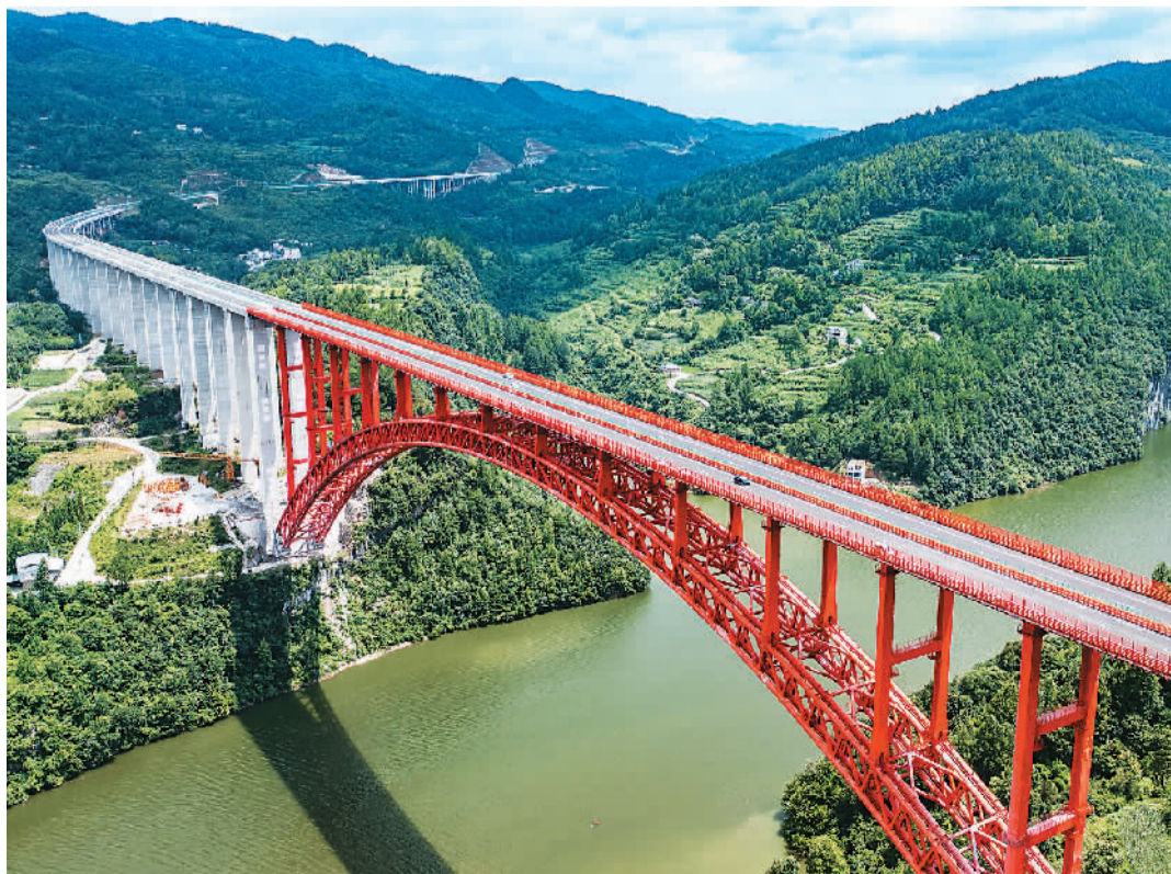
七月十日, 贵州省德江至余庆高速公路全线建成通车。德余高速公路建成通车对完善当地高速公路路网结构、推动武陵山集中连片区域经济社会发展具有重要意义。图为当日, 车辆行驶通过德余高速公路乌江特大桥。

“中国在过去几十年快速发展中积累的经验, 为帮助非洲实现脱贫提供了可资借鉴的路线图。”美国哥伦比亚大学可持续发展中心主任杰弗里·萨克斯认为, 在中国的诸多经验中, 对人力资本、基础设施等领域的大量投资尤其值得非洲国家学习。