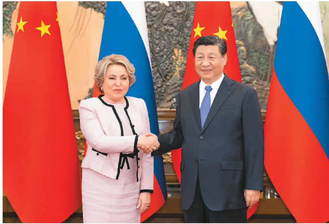
七月十日下午, 国家主席习近平在北京人民大会堂会见俄罗斯联邦委员会主席马特维延科。