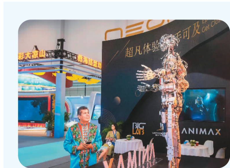
一名来自新疆维吾尔自治区库车市的游客在浙江省宁波国际会展中心观看智能机器人表演。

目前，中国已经与149个共建“一带一路”国家中的142个国家签订文化和旅游协定或谅解备忘录，启动实施“文化丝路”等系列重大计划，联合考古、文物展览等国际交流合作全面开展，推动中外文化交流持续向