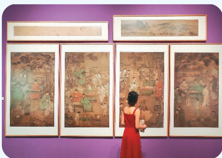
盛世修典——“中国历代绘画大系”成果展·宁波特展在浙江宁波美术馆开幕。图为市民在观展。