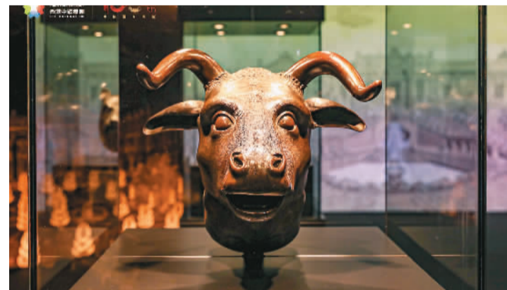
圆明园海晏堂十二生肖之牛首原物。

本报电（记者赵珊）近日，中国旅游集团（香港中旅集团）联合中国保利集团、香港城市大学，在香港举办“盛世瑰宝 天宝芳华——庆祝香港回归祖国26周年暨中旅百年华诞圆明园国宝首展文物展”。