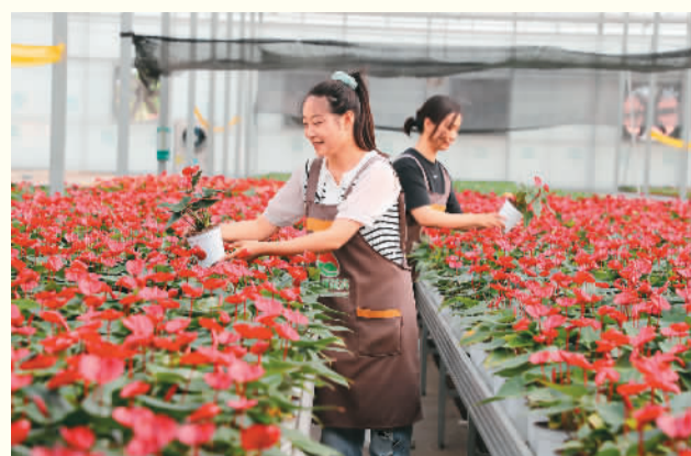
山东双福花卉有限公司技术员在管理花卉。

博览会期间，还举办了“中华文化与现代制造创新大会”“首届价值中国品牌文化圆桌对话”“盛世修典——‘中国历代绘画大系’成果展·宁波特展”“海丝文旅产业招商推介会”“宁波文博奇妙夜”等多项各具特色的配套活动，进一步把海丝文化传递到市民身边，让本届博览会不仅是文旅展示、交流、交易的焦点，也成为全城联动、全民共享的“文化大餐”。