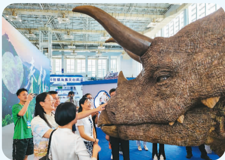
在2023海丝之路文化和旅游博览会上，游客们与“恐龙”零距离互动。