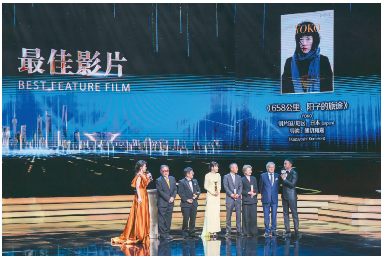
第二十五届上海国际电影节金爵奖颁奖典礼现场